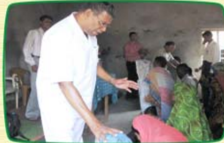
சபை மக்களுக்காக ஜெபித்தல்