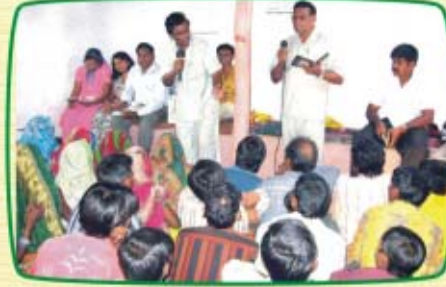
முண்டத் (ம.பி.) ஆலய ஆராதனையில்