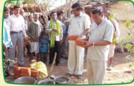
டெட்லா (ம.பி.) ஆலய அடிக்கல் நாட்டுதல்