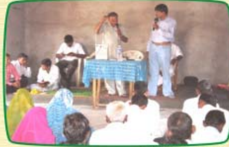
பேடோ (இராஜஸ்தான்) ஆலயத்தில்...