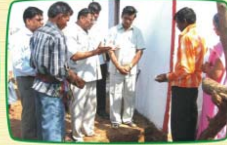
முண்டத் (ம.பி.) பெரிய ஆலய அடிக்கல் நாட்டுதல்