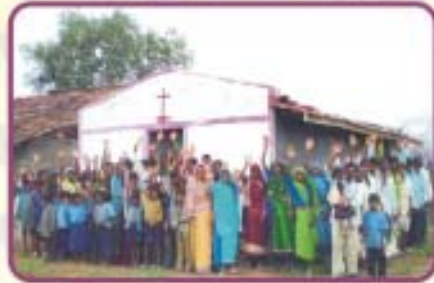
வாக்கனோர் (ராவ்தா), இராஜஸ்தான்