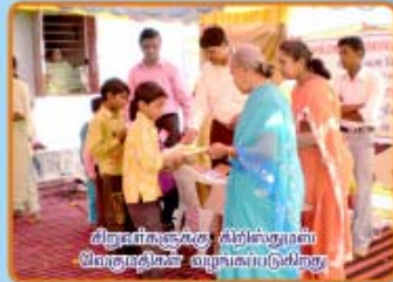
பிறவர்களுக்கு திறிஸ்துமஸ் வெகுமதிகள் வழங்கப்படுகிறது