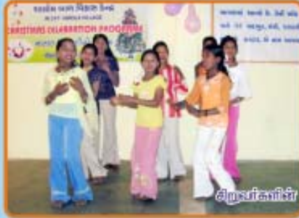
பிறவர்களின் கலை நிகழ்ச்சிகள்