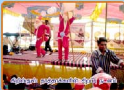
திறிஸ்துமஸ் தாத்தாக்களின் சிறப்பு நடை