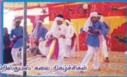
கிறிஸ்துமஸ் கலை நிகழ்ச்சிகள்

Owned and Published by V. Devadoss from 168/5, Caldwell Colony, 3rd Street, Tuticorin - 628 008. and Printed by S. Joseph at Rajan Press, 59, Palayamkottai Road, Tuticorin - 628 002. Editor : V. Devadoss