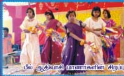
பீல் ஆதிவாசி மாணவர்களின் சிறப்பு