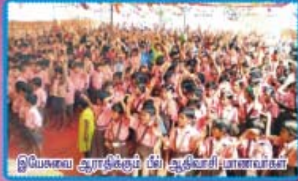
இயேசுவ ஆராதக்கும் பி. ஆதிவாசி மாணவர்கள்