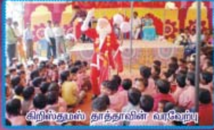
கிறிஸ்துமஸ் தாத்தாவின் வரவேற்பு