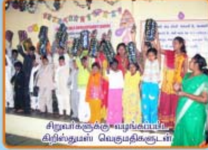
சிறுவர்களுக்கு வழங்கப்பட்ட திறிஸ்துமஸ் வெகுமதிகளுடன்