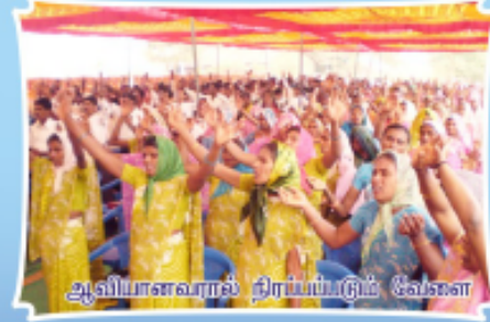
ஆவியானவரால் நிரப்பப்படும் வேளை