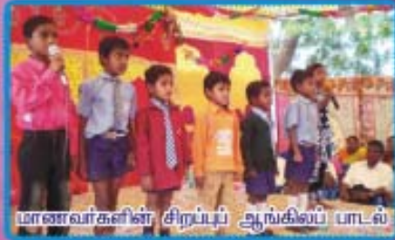
மாணவர்களின் சிறப்பு ஆங்கிலப் பாடல்