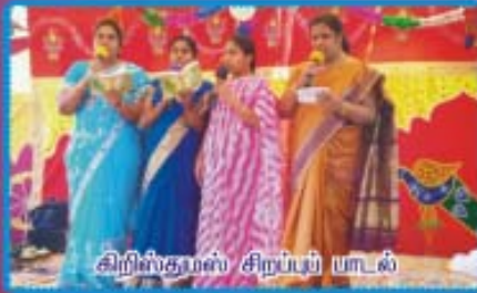
கிறிஸ்துமஸ் சிறப்புப் பாடல்