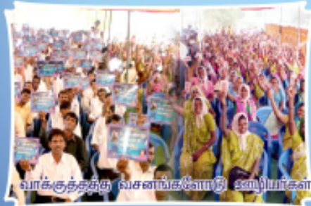
வாக்குத்தந்தி வசனங்களை நினைவுகூர்