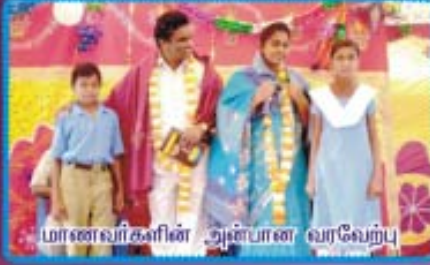
மாணவர்களின் அன்பான வரவேற்பு

ஆராஜஸ்தாக், ரிஜல்பூர் ஷாஹீலாம் பள்ளி மற்றும் விசுத் மாணவர்கள் மத்தியில் நடைபெற்ற கிறிஸ்துமஸ் கொண்டாட்டங்கள்