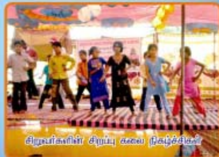
சிறுவர்களின் சிறப்பு கலை நிகழ்ச்சிகள்