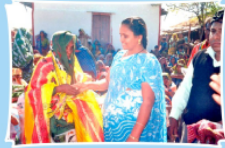
முண்டத் கிராம ஆலயத்தின் சார்பில் 80 விதவைப் பெண்களுக்கு புத்தாடைகள் வழங்கப்பட்டது