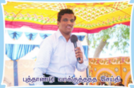
புத்தாண்டு வாக்குத்தந்தி சேய்தி