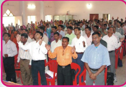
சொந்த பீல் ஜனங்களள் இரட்சிக்கப்பட அர்ப்பணிப்பின் ஜெபம்