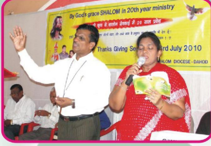
பாடல் மற்றும் ஆராதனை வேளை