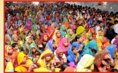
கூடியிருந்த சபை விசுவாசிகள்