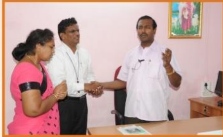
ஷாலோம் பிஷப் அலுவலகத்திற்காக சிறப்பு ஜெபம், தாகோத், குஜராத்