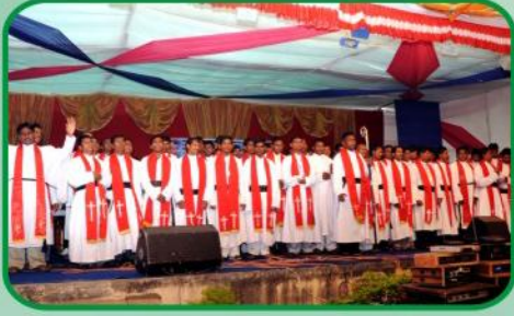
77 ஷாலோம் போதகர்களுக்கான சிறப்பு ஜெபம்