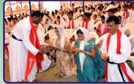
கர்த்தருடைய திருவிருந்து ஆராதனை