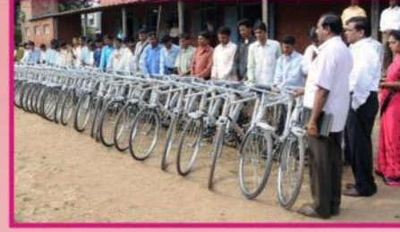
ஷாலோம் பீல் ஆதிவாசி சுகேச ஊழியர்களுக்கு வழங்கப்படும் 200 சைக்கிள்களில் ஒரு பகுதி (40 சைக்கிள்கள்)