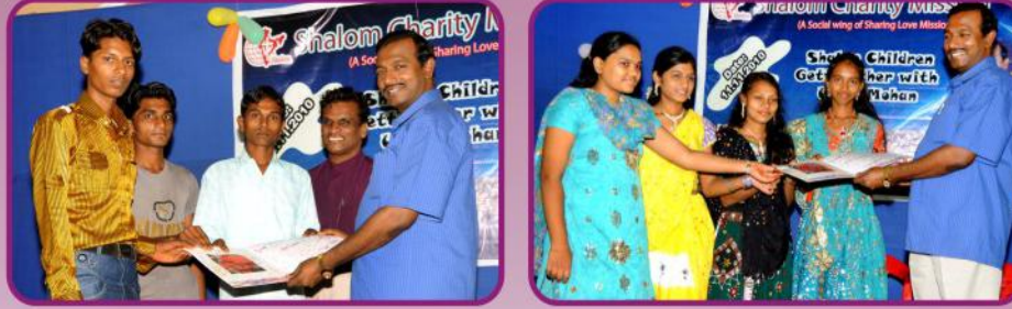
வாழ்த்து அட்டைகள் கொடுத்து வரவேற்பு