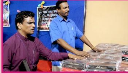
சுகேச ஊழியர் பிள்ளைகளுக்கு வழங்கப்பட்ட 1000 வேதாகமங்கள்