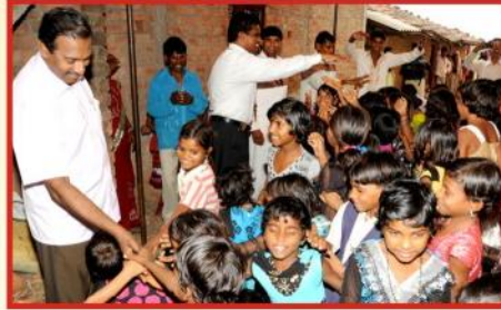
Compassion Project சிறுவர்களுடன்