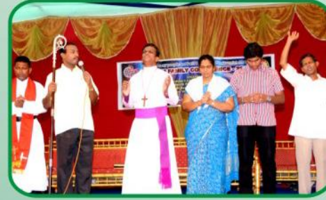
பிஷப் கோல் ஜெபித்து, பிஷப் தேவதாஸ் அவர்களிடம் வழங்கப்படுகிறது