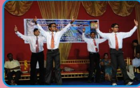
அலுவலக ஊழியர்களின் நடன நிகழ்ச்சி