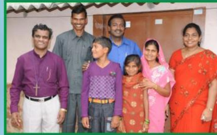
சபை போதகர் ஹவுசிங் சங்காடா அவர்கள் குடும்பத்துடன்