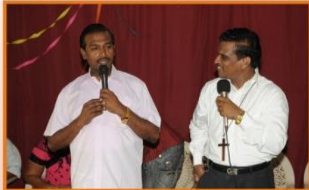
குஜராத் தாகோத், பணித்தள அலுவலக ஊழியர் கூடுகையில்...