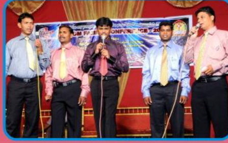
பணித்தள அலுவலக ஊழியர்களின் சிறப்பு பாடல்கள்