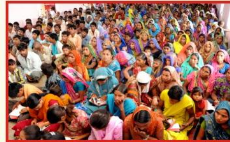
கூடியிருந்த சபை விசுவாசிகள்