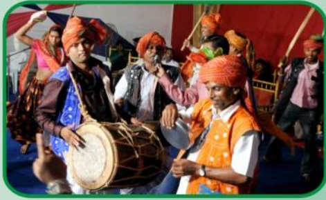
பீல் ஆதிவாசி கலாச்சார நடன வரவேற்பு