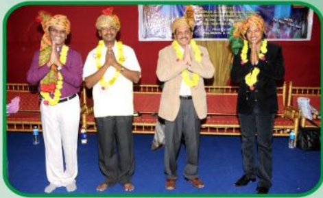
தேவதாசர்களுக்கு உற்சாக கலாச்சார வரவேற்பு