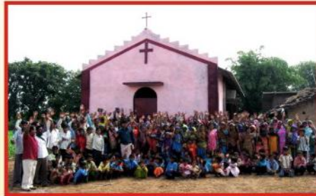
ஆலயத்தின் முழுத் தோற்றம்