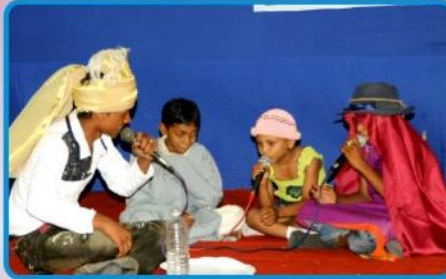
இயேசுவே இரட்சகர் - நாடகம்