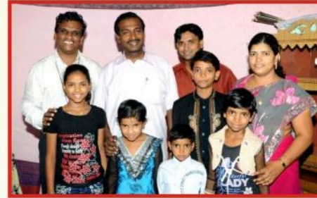
சபை போதகர் புர்சன்புரியா குடும்பத்துடன்