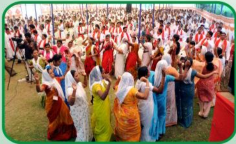
நடனத்துடன் தேவனை பாடி, துதித்து மகிமைப்படுத்துதல் அன்பு பகிர்வு இயக்கம் செய்தி மலர்