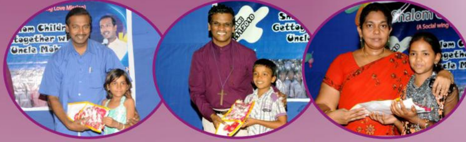
மலர் கொடுத்து கொடுத்து வரவேற்பு