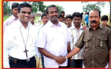
சபை மூப்பர் நகின் பாய் அவர்களுடன்