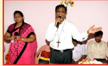
பாடல் & ஆராதனை வேளை