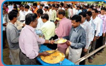
சுவையான உணவு வழங்கப்படுகிறது