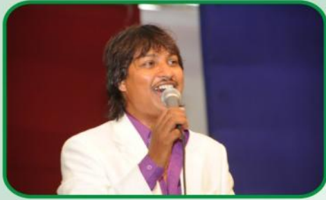
மகிமையான பாடல் மற்றும் ஆராதனை வேளை