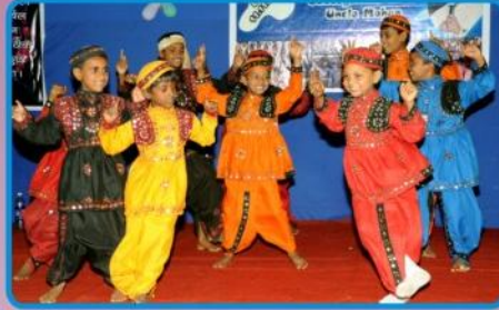
குட்டிஸ் நடன வேளை