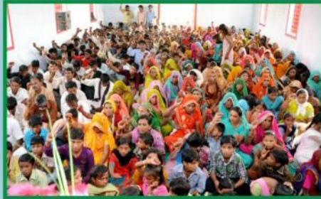
கூடியிருந்த பாரேவா சபை விசுவாசிகள்