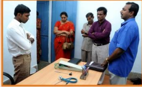
மருத்துவமனைக்காக சிறப்பு ஜெபம்