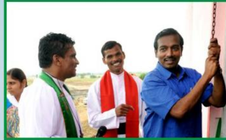
ஆலய மணி பிரதிஷ்டை