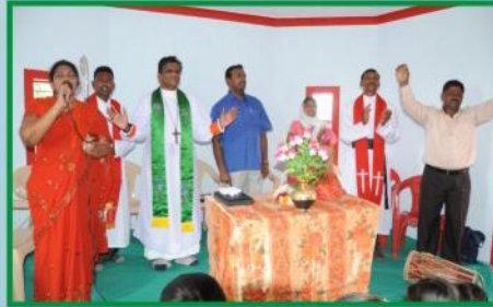
பாடல் & ஆராதனை வேளை