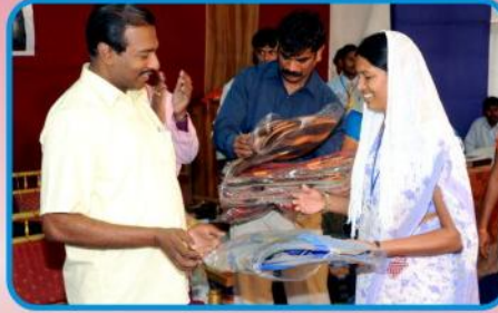
வேத வசன போட்டிக்கான சிறப்பு பரிசுகள்