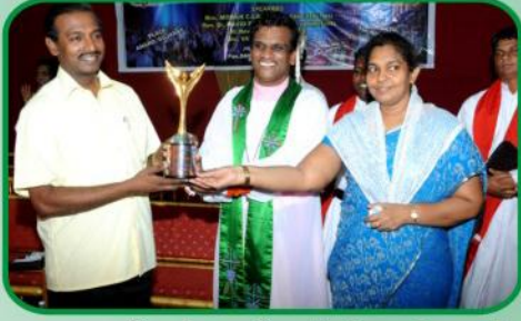
ஷாலோம் ஊழிய சிறப்பு பங்காளர் கேடயம் மற்றும் நினைவுப் பரிசு வழங்குதல்