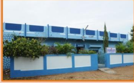
நமது மருத்துவமனையின் வெளித் தோற்றம்

ஷாரோன் நினைவு மருத்துவமனை (ஜாலோத், குஜராத்) பார்வையிடல்