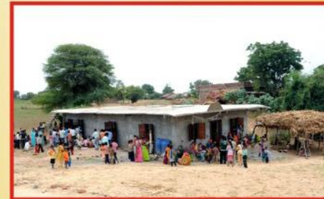
ஆலய முழு தோற்றம்