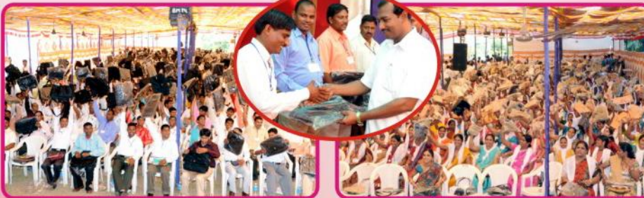
ரூ. 2 லட்சம் மதிப்பில் 500 சுகேச ஊழியர் குடும்பங்களுக்கு Bag மற்றும் Scarf வழங்கப்பட்டது