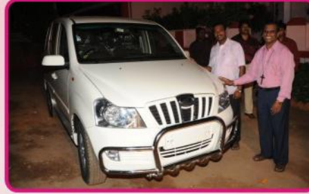
பழைய BOLERO ஜீப்பிற்குப் பதிலாக இயேசு விடுவிக்கிறார் ஊழியத்தின் மூலமாக பணித்தள ஊழியங்களை நிறைவேற்ற புதிதாக வாங்கப்பட்டுள்ள XYLO வாகனம்