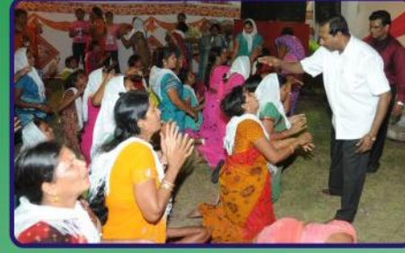
உன்னத அபிஷேக ஜெபவேளை