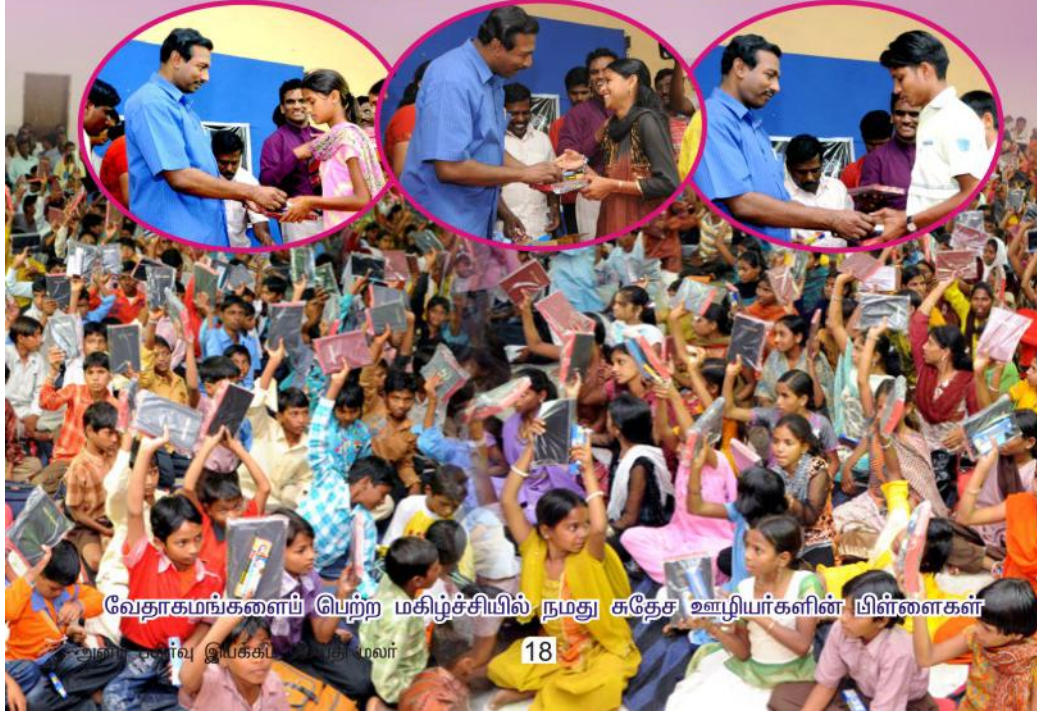
வேதாகமங்களைப் பெற்ற மகிழ்ச்சியில் நமது சுதேச ஊழியர்களின் பிள்ளைகள்