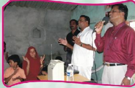
புதிய ஆலயத்திற்கான ஸ்தோத்திர ஜெபம்