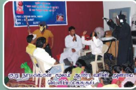
குறு நாட்கங்கள் மூலம் ஆண்டவரின் அன்பை வெளியிட்டுத்தூதல்