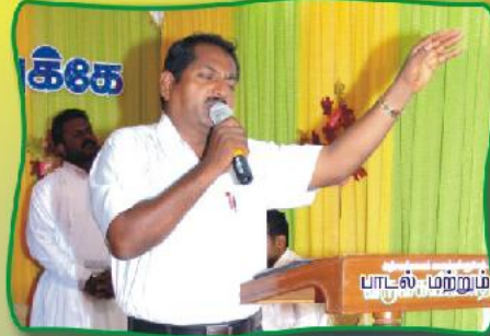
பாடல் மற்றும் ஆராதனை வேளை