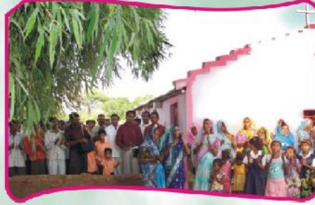
ஜன்வானியா, ம.பி. கிராம ஆலய பிரதிஷ்டை