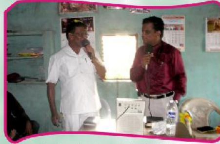
Pr. ஆமோஸ் மற்றும் அவர்கள் செய்தியளிக்கிறார்.