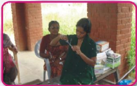
இரத்தப் பரிசோதனை நடைபெறுகிறது