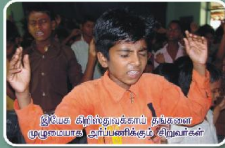
இயேசு கிறிஸ்துவவுக்காய் தங்களை முழுமையாக அர்ப்பணிக்கும் சிறுவர்கள்