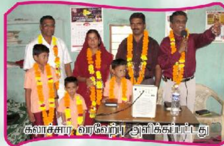
கவாச்சார வரவேற்பு அளிக்கப்பட்டது