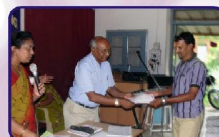
பயிற்சி பெற்றவர்களுக்கு சான்றிதழ்கள் அளிக்கப்படுகின்றன