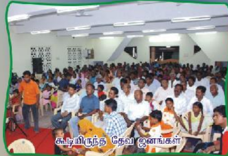
கூடியிருந்த தேவ ஜனங்கள்