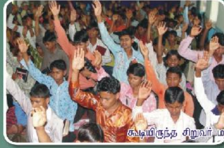
சுவாமிருந்த சிறுவர் மற்றும் சிறுமியரில் ஒரு பகுதி