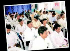
ஆரம்ப சுகாதார பயிற்சி