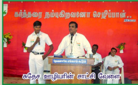
சுதேச ஊழியரின் சாட்சி வேளை