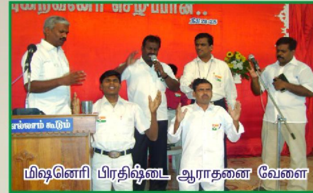
மிஷனரி பிரதிஷ்டை ஆராதனை வேளை