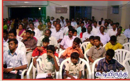
கூடியிருந்த தேவ ஜனங்கள்