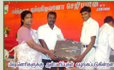
மிஷனரிகளுக்கு அன்பளிப்புகள் வழங்கப்படுகின்றன