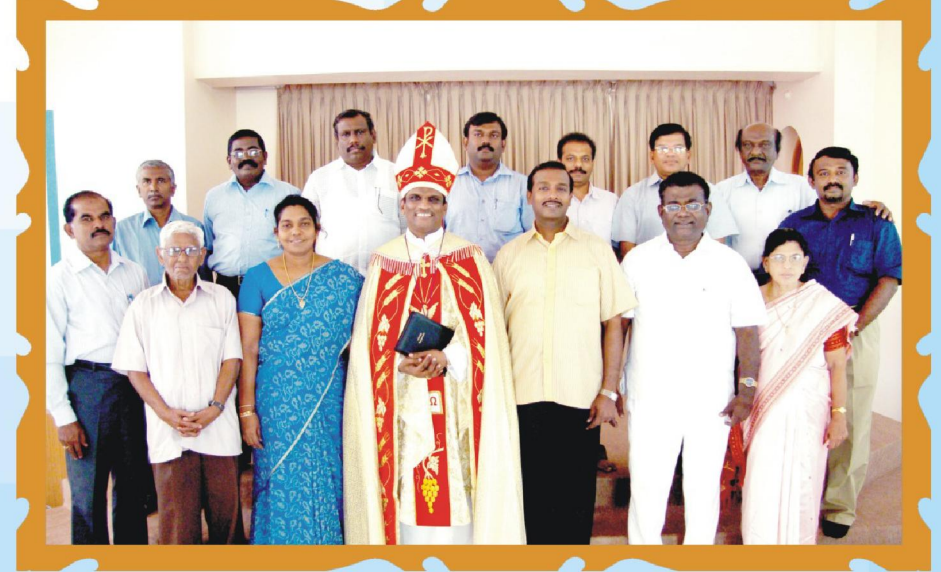
நமது ஷாலோம் செயற்குழு உறுப்பினர்கள் அனைவரும்

அவர் சிறியவனைப் புழுதியிலிருந்து எடுத்து, எளியவனைக் குப்பையிலிருந்து உயர்த்துகிறார், அவர்களைப் பிரபுக்களோடு உட்காரவும், மகிமையுள்ள சிங்காசனத்தைச் சுதந்தரிக்கவும் பண்ணுகிறார். 1 சாமு. 2:8