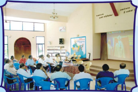
ஷாலோம் திருமண்டல ஆரம்ப விழா வீடியோ படகாட்சியாக காண்பிக்கப்படுகிறது