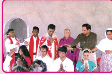
மிஷனரி பிரதிஷ்டை ஆராதனை