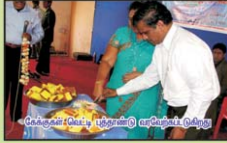
கேக்குகள் வெட்டி புத்தாண்டு வாழ்த்தப்பட்டுகிறது