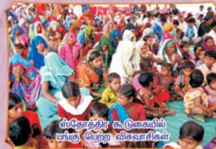
ஸ்தோத்திர கூடுகையில் பங்கு பெற்ற விகவாசிகள்