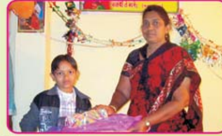
ஹிரோலா கிராமம் - குஜராத்.