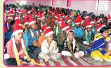
ஜெரி கிராமம் - குஜராத்.