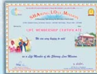
ஆயுள்கால அங்கத்தினர் சான்றிதழ்

மேலும் உங்கள் காணிக்கையை Sharing Love Mission – என்ற பெயருக்கு D.D. or Cheque or M.O. அல்லது Net Transfer மூலமாக அனுப்பலாம்.