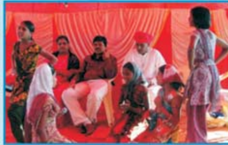
கிறிஸ்துவின் பிறப்பைக் குறித்த நடனங்கள் & நாடகங்கள்