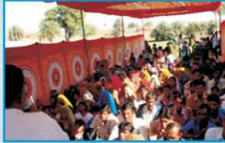
கூடியிருந்த திரளான ஜனங்கள்