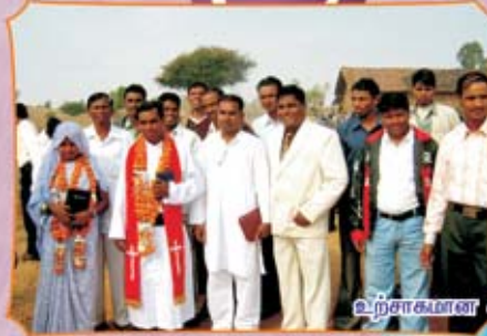
உற்சாகமான கலாச்சார வரவேற்பு