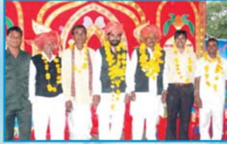
ஊர் தலைவர்களுடன் நமது கதேச ஊழியர்