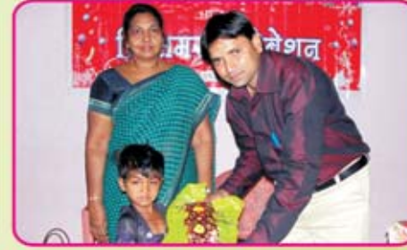
அந்தர்வேலியா கிராமம் - மத்தியப்பிரதேசம்