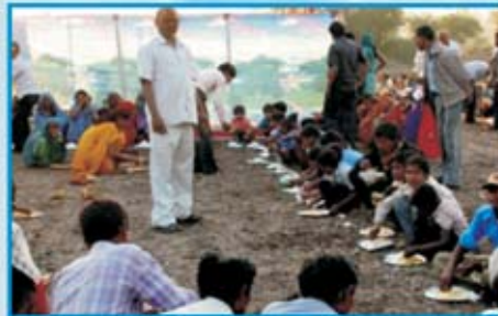
பங்கேற்ற அனைவருக்கும் சிறப்பு விருந்து அன்பு பகிர்வு இயக்கம் செய்தி மலர்

இராஜஸ்தான் மாநிலத்தில் கடந்த டிசம்பர் மாதம் 20 ம் தேதி முதல் 24ம் தேதி வரை இராஜஸ்தானில் கிறிஸ்தமஸ் மேளா மிகவும் சிறப்பாக நமது பீல் கதேச ஊழியர்கள், விசுவாசிகள் மற்றும் மூப்பர்கள் கொண்டாடினார்கள். அநே புறஜாதியாரும் பங்கு பெற்று தேவனை மகிமைப்படுத்தினார்கள்