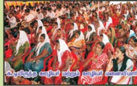
கூடியிருந்த ஊழியர் மற்றும் ஊழியர் மனைவிமார்