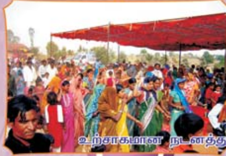
உற்சாகமான நடனத்துடன் தேவனைத் துதித்தல்