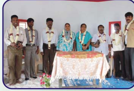
பாரேவா கிராம சபையில் கலாச்சார வரவேற்பு