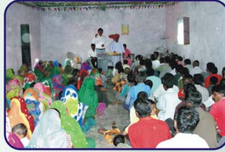
பாடலா கிராம சபையில் ஆராதனை வேளையில்