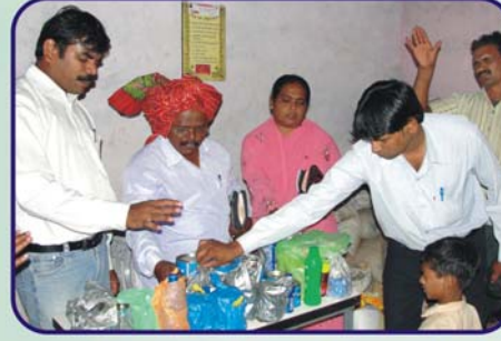
பாடலா கிராம சபையில் ஜெப எண்யெய்க்கான ஜெபம்