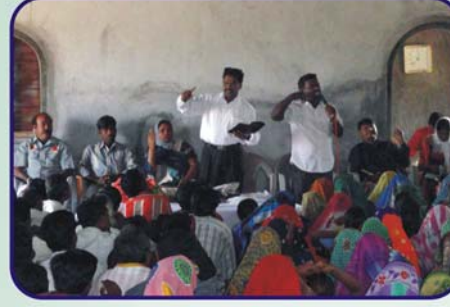
பாடலா கிராம சபையில் செய்தி வேளை