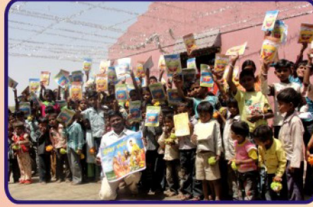
நகரேலா கிராம ஆலயத்தில் நடைபெற்ற CBC