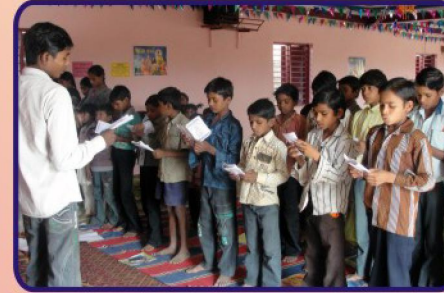
கங்கேலா கிராம ஆலயத்தில் நடைபெற்ற CBC