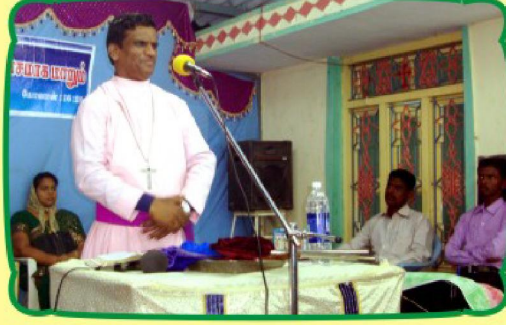
செய்தி வேளையில் பிஷப் தேவதாஸ் அவர்கள்