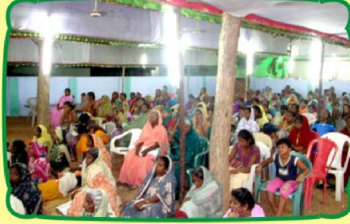
கூடியிருந்த தேவ ஜனங்கள்