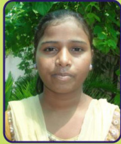
Name Rutha ben Father's Name Ramsu Damor Village Vankor State Gujarat Education Computer 2nd yr