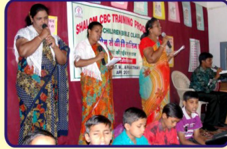
பாடல் மற்றும் ஆராதனை வேளை