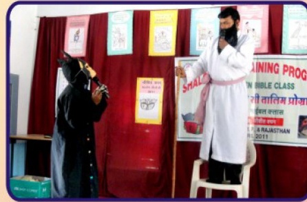
கலை நிகழ்ச்சிகள் வாயிலாக பயிற்சி