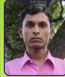
Name Deep Bhai Father's Name Puniya Mavi Village Nanikharej State Gujarat Education English 2nd Year