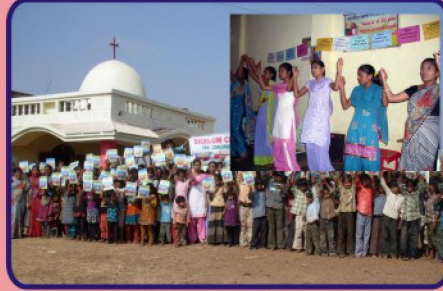
ஹிரோலா கிராம ஆலயத்தில் நடைபெற்ற CBC