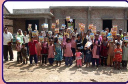
கொலானா கிராம ஆலயத்தில் நடைபெற்ற CBC