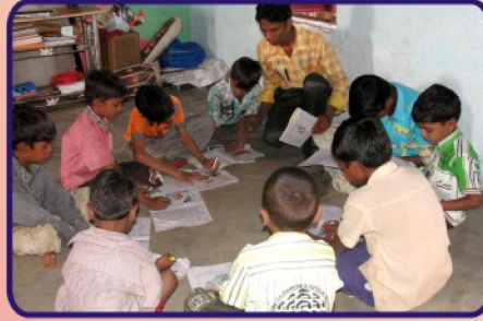
வரம்கோடா கிராம ஆலயத்தில் நடைபெற்ற CBC