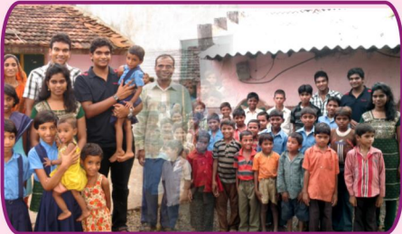
இராஜஸ்தான், கோய்கா விடுதி சிறுவர்களுடன் அன்பு பகிர்வு இயக்கம் செய்தி மலர்