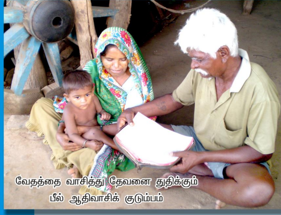
வேதத்தை வாசித்து தேவனை துதிக்கும் பீல் ஆதிவாசிக் குடும்பம்