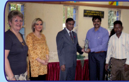
பணித்தளத்தில் அதிகப்படியாக வேதாகமம் விநியோகிக்கப்பட்டமைக்கான BSI விருது