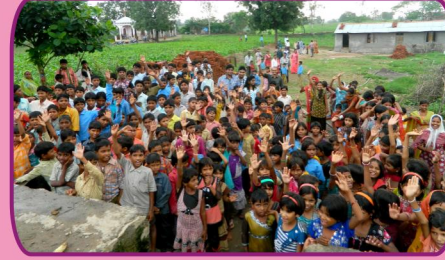
இராஜஸ்தான், பிஜல்பூர் விடுதி சிறுவர்களுடன்