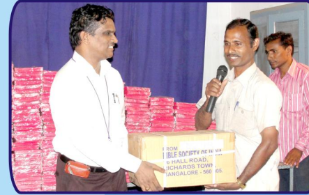
விசுவாசிகளுக்காக ஊழியர்களிடம் வழங்கப்படும் வேதாகமங்கள்