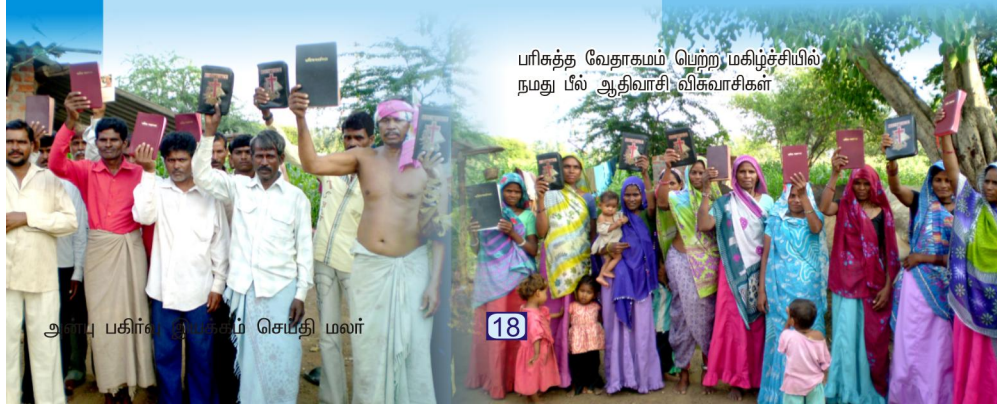
பரிசுத்த வேதாகமம் பெற்ற மகிழ்ச்சியில் நமது பீல் ஆதிவாசி விசுவாசிகள்