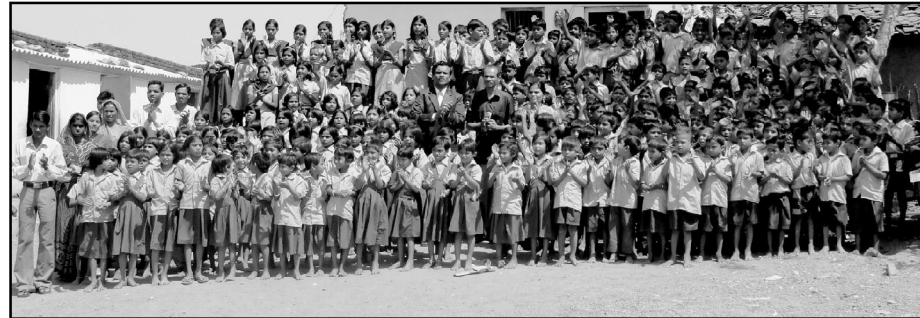
நமது ஷாலோம் விடுதி ஆதிவாசி சிறுவர்கள்

நீங்கள் இப்படிப்பட்ட சிறுவர் பணிக்கென்று நீங்கள் தாங்க முன்வந்தால் நமது ஷாலோம் தலைமை அலுவலகத்திற்கு, Shalom Charity Mission என்ற பெயரில் D.D. அல்லது Cheque அல்லது M.O. எடுத்து அனுப்பலாம். நாம் இன்னும் சற்று தாமதித்தால் இந்த சிறுவர்களின் குழந்தைப் பருவம் முடிந்துவிடும் ஆகவே இந்த சிறுவர்களை பராமரிக்கும்படியாக தேவன் நமக்குத் தந்த கடமைதனை உணர்ந்து செல்படுவோம் வாருங்கள்! தேவன் தாமே உங்களையும் உங்கள் பிள்ளைகளையும் ஆசீர்வதிப்பாராக!