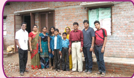
தெலுசர் கிராம ஆலயத்தில் போதகர் குடும்பத்துடன்