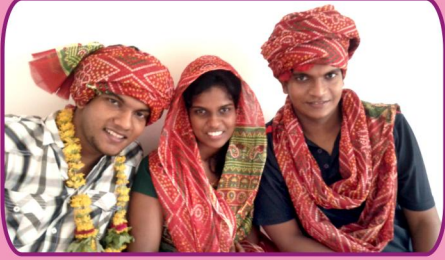
இராஜஸ்தான், கோய்கா கிராமத்தில் கலாச்சார வரவேற்பு