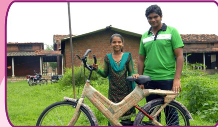
குஜராத், ஜெரி கிராம CDC சிறுவர்களுக்கு மிதி வண்டிகள் வழங்கும் சகோ. டைட்டஸ் மற்றும் சகோ. ஷாலோம்