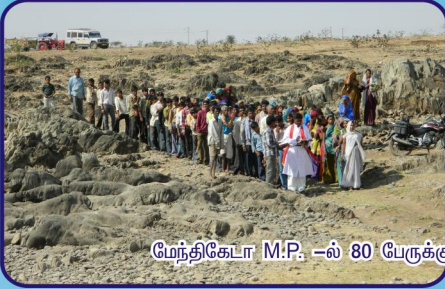
மேந்திகோடா M.P. -ல் 80 பேருக்கு நடைபெற்ற ஞானஸ்நான ஆராதனை