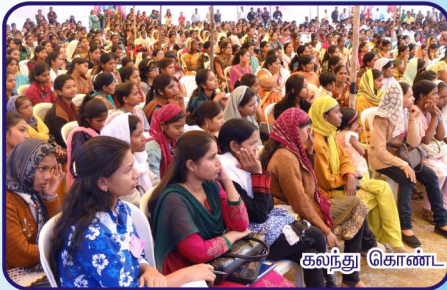
கலந்து கொண்ட திரளான வாலிபர்கள்