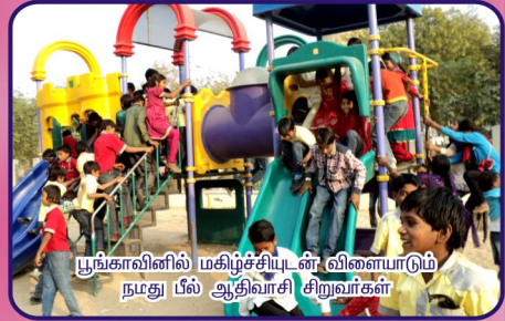
பூங்காவிலில் மகிழ்ச்சியுடன் விளையாடும் நமது பல் ஆதிவாசி சிறுவர்கள்