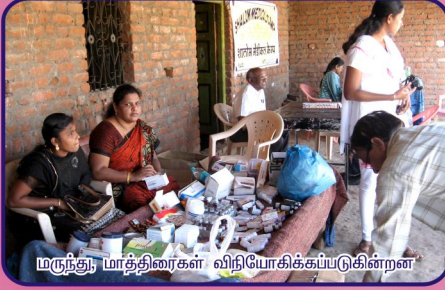
மருந்து, மாத்திரைகள் விநியோகிக்கப்படுகின்றன