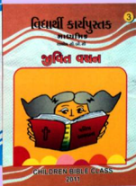
CBC பயிற்சி புத்தகங்கள்

தேவன்தாமே உங்களையும் உங்கள் குடும்பத்தின் பிள்ளைகளையும் ஆசீர்வதிப்பாராக!