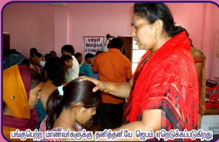
பங்குபெற்ற மாணவர்களுக்கு தனித்தனியே ஜெபம் ஏற்றெடுக்கப்படுகிறது