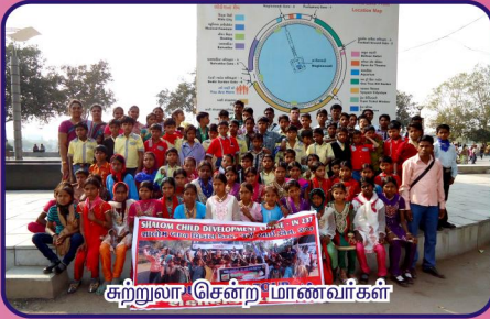
சுற்றுலா சென்ற மாணவர்கள்