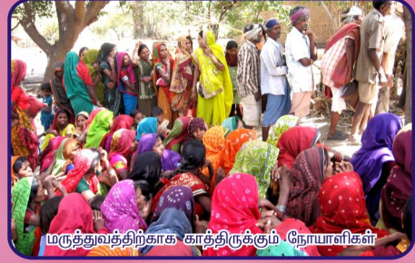
மருத்துவத்திற்காக காத்திருக்கும் நோயாளிகள்