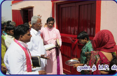
முண்டத் M.P. கிராம ஆலய பிரதிஷ்டை