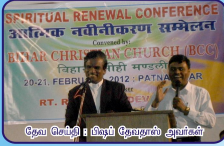
தேவ செய்தி : பிஷப் தேவதாஸ் அவர்கள்