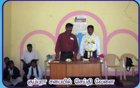
கும்புரா சபையில் செப்தி வேளை