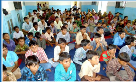
கூடுதககளில் பங்கேற்ற மாணவ மாணவிகள்