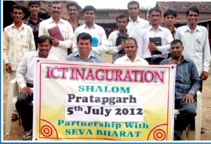
இராஜஸ்தான் பயிற்சி குழு மற்றும் மாணவர்கள்