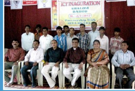
குஜராத் பயிற்சி குழு மற்றும் மாணவர்கள்