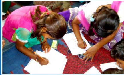
ஆதரவாளர்களுக்கு நன்றிக்கடிதம் எழுதும் மாணவ, மாணவிகள்