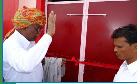
நவபாடா கிராம ஆலயப்பிரதிஷ்டை, மத்தியப்பிரதேசம்