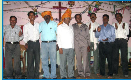
குழுவினருக்கு வரவேற்பு - ஹசல்வட், ம.பி.