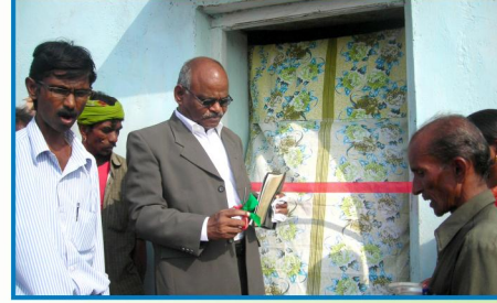
டாவாலா கிராம ஆலயப்பிரதிஷ்டை, இராஜஸ்தான்