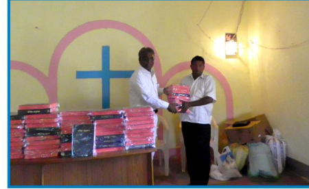
வேதாகம விநியோகம் கும்புரா,