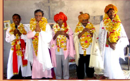
உற்சாகமான கலாச்சார வரவேற்பு