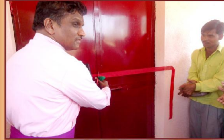
பாடல்புரா ஆலயத்தினை பிரதிஷ்டை செய்யும் பிஷப் தேவதாஸ் அவர்கள்