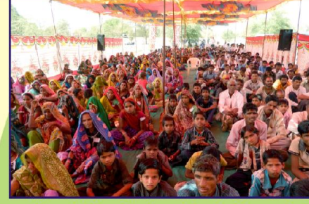
கவிசேஷத்திற்கு செவி சாய்க்கும் பீல் ஜனங்கள்