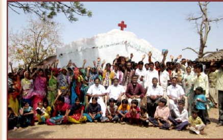
விசல்பூர் (ம.பி.) ஆலய சந்திப்பில்