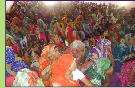
கூடியிருக்கும் தேவ ஜனங்கள்