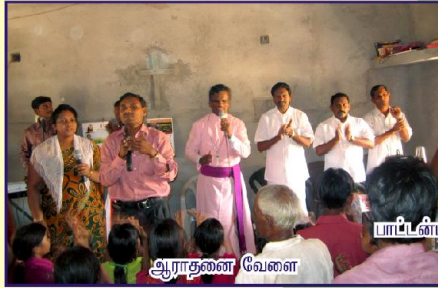
அன்பு பகிர்வு இயக்கம் செய்தி மலர்