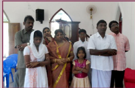
ஊழியரைத் தாங்கும் குடும்பத்தினர் அன்பு பகிர்வு இயக்கம் செய்தி மலர்