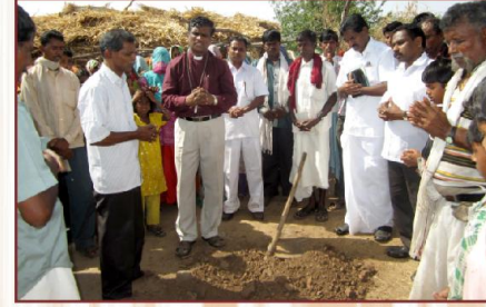
ராம்புரி ஆலய அடிக்கல் நாட்டு விழா