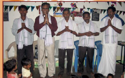
சொக்வாடா (ம.பி.) ஆலய சந்திப்பில்