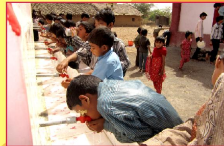
சுத்தமான நல்ல குடிநீரை சந்தோஷமாக குடிக்கும் நமது பல் ஆதிவாசி மாணவர்கள்