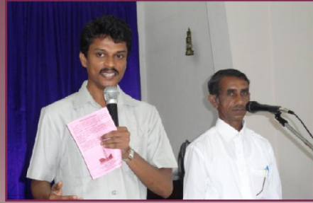
மிஷனரி சாட்சி வேளை