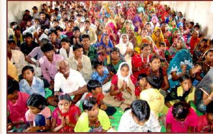
பாடல்புரா ஆலய பிரதிஷ்டை ஆராதனையில் கடிமிருந்த தேவஜனம்