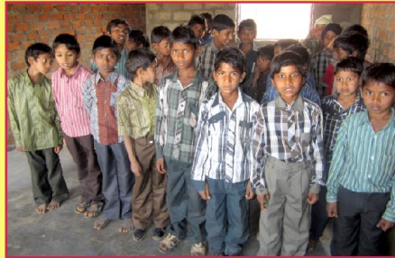
புதிய விடுதி கிடைத்த மகிழ்ச்சியில் மாணவ மாணவிகள்