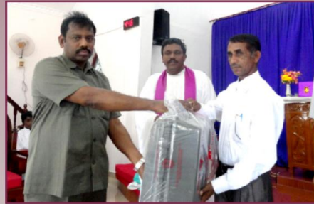
ஊழியருக்கு வழங்கப்படும் அன்பளிப்புகள்