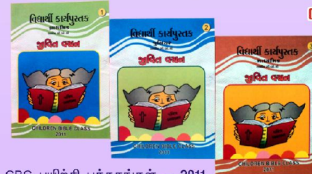
CBC பயிற்சி புத்தகங்கள் - 2011

அதே போல் இந்த ஆண்டும் “எனது அழகான இருதயம்” என்கின்ற தலைப்பில் 30000 சிறுவர்களுக்கு 600 கிராமங்களில் CBC நடத்த ஜெபத்துடன் செயல்பட்டு வருகிறோம். இதற்கான தேவைகள் 600 ஆசிரியர்களுக்கான பயிற்சிக் கையேடுகள், 30000 CBC புத்தகங்கள், Badge. (30000), பாட்டுப் புத்தகங்கள் (10,000), கவர் பென்சில்கள், பேனாக்கள் (5000 Sets), CBC புத்தகங்கள் நேர்த்தியாக பிரின்ட் செய்யவும், மற்ற பொருட்கள் வழங்கவும் ஒரு குழந்தைக்கு தலா ரூ. 10/- வீதம் 30000 குழந்தைகளுக்கு ரூ. 3 இலட்சம் தேவைப்படுகிறது. இதுவரை ரூ. 1.7 இலட்சம் கிடைக்கப் பெற்றுள்ளோம். மீதி 1.3 இலட்சம் தேவை சந்திக்கப்பட ஜெபியுங்கள். மேலும் உங்கள் குடும்பத்தின் சார்பிலோ, ஊழியத்தின் சார்பிலோ அல்லது சபையின் சார்பிலோ ஒரு குழந்தைக்கு ரூ. 10/- வீதம் உங்களால் முடிந்த அளவிலான குழந்தைகளுக்கு கொடுத்து இந்த சிறுவர் ஊழியத்தைத் தாங்க முன்வாருங்கள்.