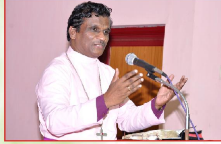
செய்தியளிக்கும் பிஷப் தேவதாஸ்