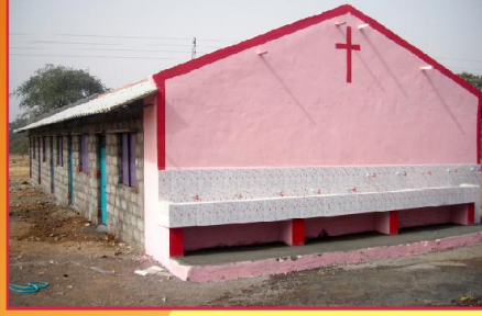
புதிதாக கட்டப்பட்டுள்ள விடுதியின் வெளித்தோற்றம்