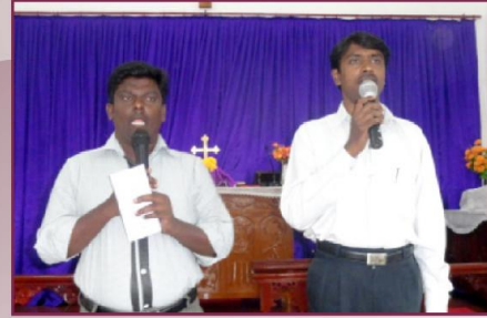
சிறப்புப் பாடல் & ஆராதனை வேளை