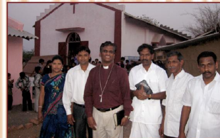
அந்தூவேலியா சபை மற்றும் ஷாலோம் மாணவர் விடுதி சந்திப்பு