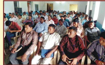
பயிற்சி பெறும் உழியர்கள்