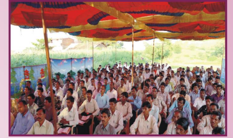
இராஜஸ்தான், ஷாலோம் சுதேச ஊழியர்கள் கூடுகை