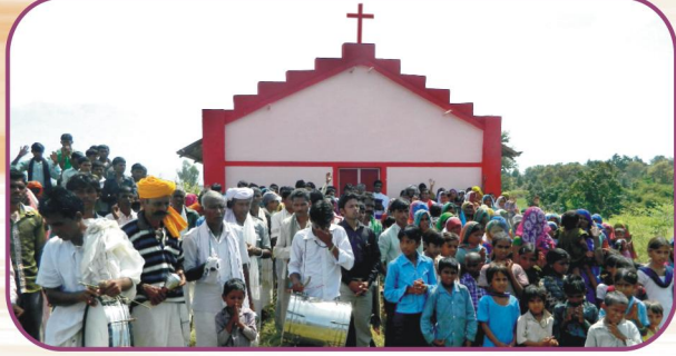
தோரண்பா (ம.பி.) கிராம சபை விசுவாசிகளுடன்