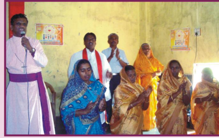
குஜராத், ஹிரோலா கிராம ஆலயம்