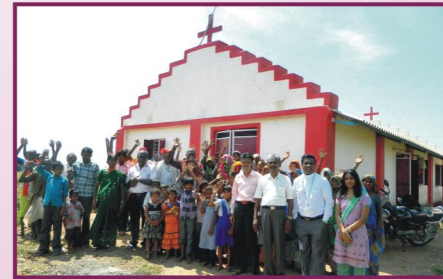
மத்தியப்பிரதேசம், காளாகேத் கிராம ஆலயம்