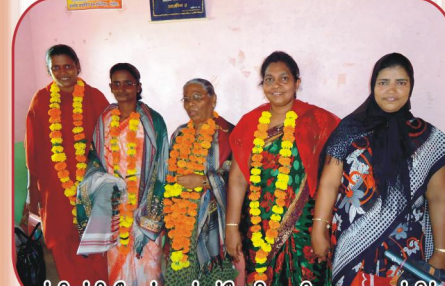
மத்தியப்பிரதேசம், அந்தர்வேலியா கிராம ஆலயத்தில் கலாச்சார வரவேற்பு