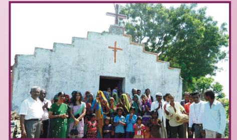
மத்தியப்பிரதேசம், பத்ரா சபை விசுவாசிகளுடன்