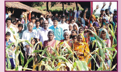
மத்தியப்பிரதேசம், தலையா கிராம ஆலய விசுவாசிகளுடன்