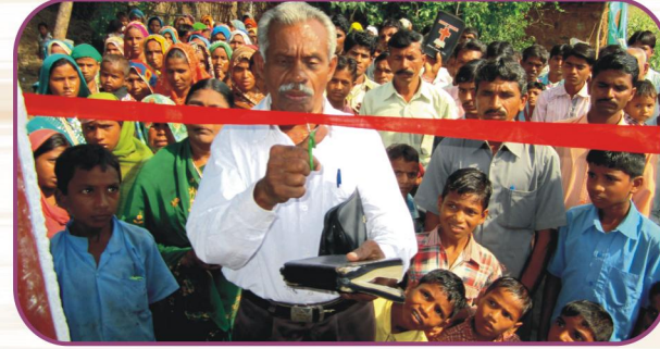
காட்டா (இராஜ) கிராம ஆலய பிரதிஷ்டை