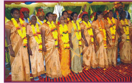
இராஜஸ்தான், பிஜல்பூர் ஊழியர் கூடுகையில் வரவேற்பு