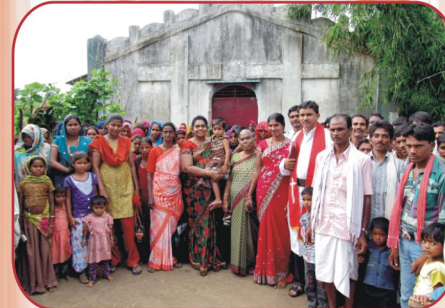
மத்தியப்பிரதேசம், தேத்லா கிராம ஆலய விசுவாசிகளுடன்