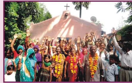
குஜராத், தேவகட் ஸோடா உதப்பூர் கிராம ஆலய விசுவாசிகளுடன்