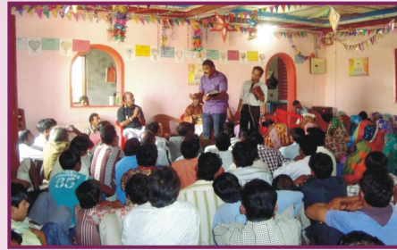
குஜராத், கங்கேலா சபை - செய்திவேளை