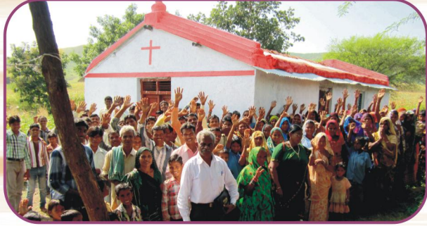
காட்டா (இராஜ) கிராம சபை விசுவாசிகளுடன்