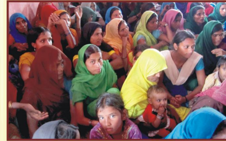
தேவ வார்த்தைக்கு செவி சாய்க்கும் பீல் ஜனங்கள்