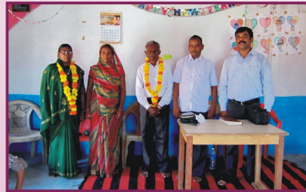
இராஜஸ்தான், பேடவ் கிராம ஆலயம்