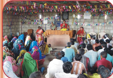
மத்தியப்பிரதேசம் முண்டத் கிராம ஆலய செய்திவேளை அன்பு பகிர்வு இயக்கம் செய்தி மலர்