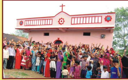
குலியா கிராம ஆலய விசுவாசிகள் மற்றும் ஆலய பிரதிஷ்டை