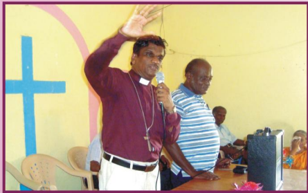
இராஜஸ்தான், கும்புரா கிராம ஆலயத்தில் வாழ்த்துரை அன்பு பகிர்வு இயக்கம் செய்தி மலர்