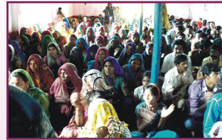
மத்தியப்பிரதேசம், வட்டா சபை மக்கள்