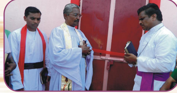
தோரண்பா (ம.பி.) கிராம ஆலய பிரதிஷ்டை