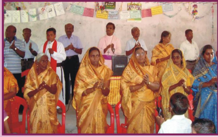
குஜராத், கொலானா கிராம ஆலய ஆராதனை