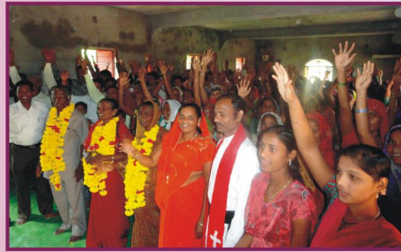
குஜராத், பாட்டன்புரா கிராம ஆலயத்தில் வரவேற்பு