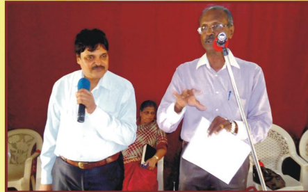
Accounts குறித்தான சிறப்பு பயிற்சி