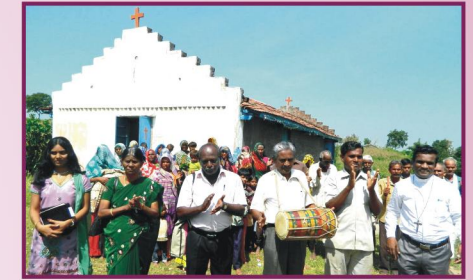
மத்தியப்பிரதேசம், குவாலி கிராம ஆலயம்