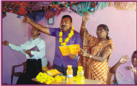
குஜராத், போர்கேடா கிராம ஆலயம்