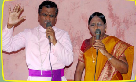
ஆலய ஆசீர்வாதத்திற்காக ஜெபிக்கும் சகோதரி.