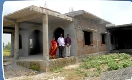
கோய்க்காவில் கட்டப்பட்டு வரும் ஷாஹீம் பேராலய பார்வை (இராஜ)