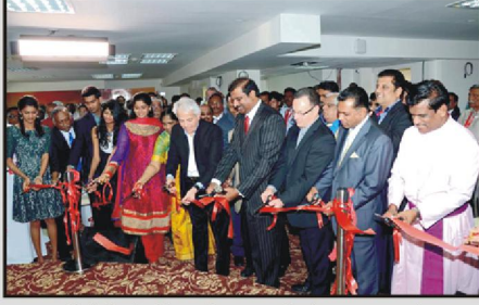
இஸ்ரேல் ஜெபக்கோபுர திறப்பு வைபவம்