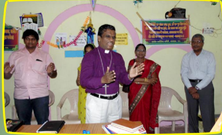
கும்புரா (இராஜ) கிராம ஆலய ஆராதனையில்