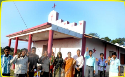
ரூபாகேடா (ம.பி.) கிராம ஆலயத்திற்கு முன்பு