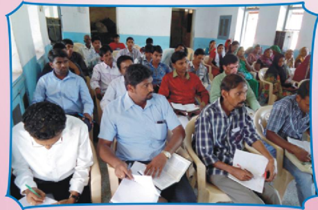
கவனத்தோடு பயிற்சிபெறும் பணியாளர்கள்