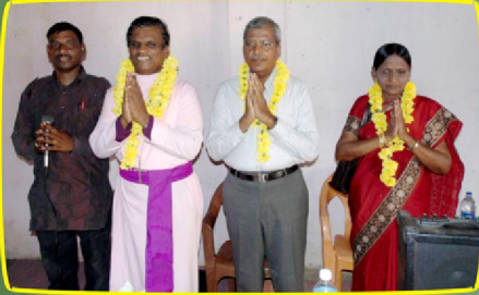
கோய்க்கா (இராஜ) கிராம ஆலயத்தில் வரவேற்பு