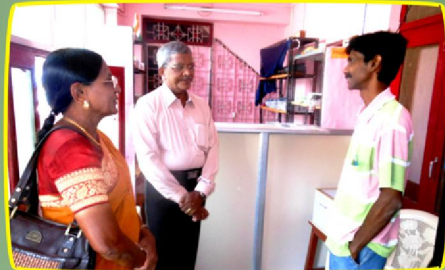
ஷாரோன் நினைவு மருத்துவமனையில்