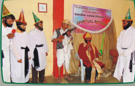
குறுநாடகங்கள் மற்றும் பொம்மலாட்டம் வாயிலாக சிறுவர்களுக்கு சிறப்பு ஆலோசனைகள்