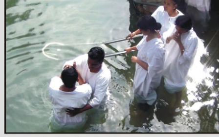
யோர்தான் நதியில் ஞானஸ்நானம்