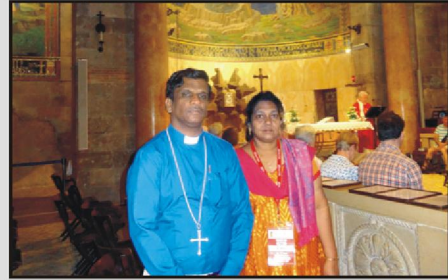
கெத்சமனே தோட்ட ஆலயத்தில்