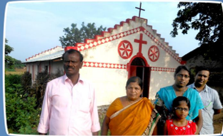
காளகேத் கிராம ஆலய சந்திப்பு (ம.பி.)