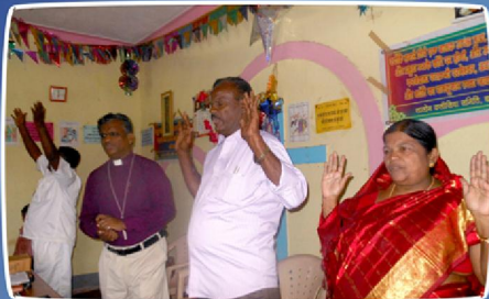
கும்புரா கிராம ஆலய ஆராதனையில் (இராஜ)