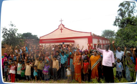
மேந்திகேடா (ம.பி.) கிராம ஆலயம் - உற்சாகமான கலாச்சார வரவேற்பு