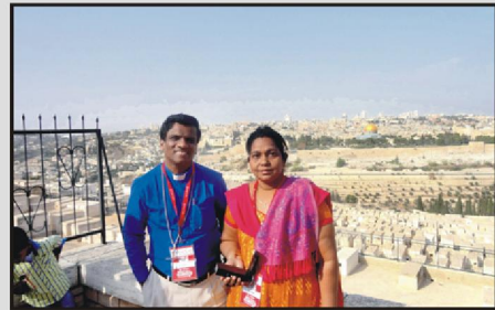
எருசலேம் தேவாலயப் பார்வை