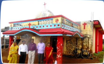
ஹிரோலா கிராம ஆலய பார்வை (குஜராத்)