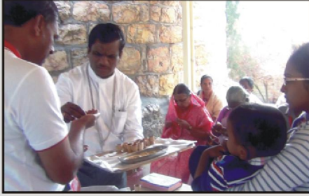
ஓலிவமலைத் தோட்டத்தில் கர்த்தருடைய பந்தி