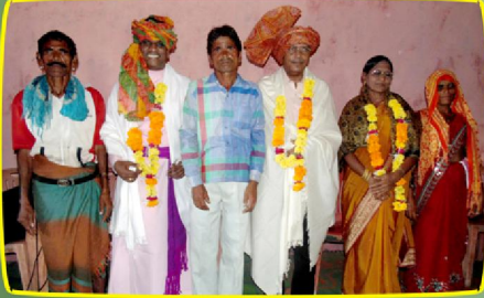
தெமேரா கிராம சபையில் கலாச்சார வரவேற்பு