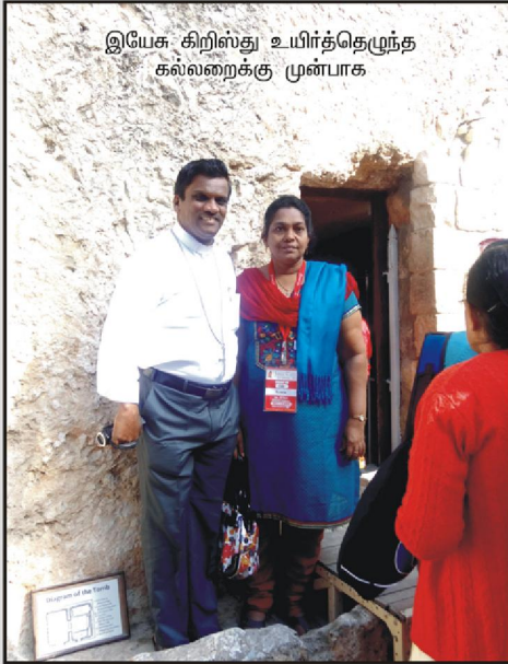
இயேசு கிறிஸ்து உயிர்த்தெழுந்த கல்லறைக்கு முன்பாக