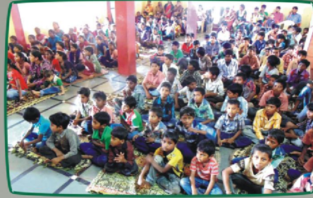
கலந்து கொண்டு பயன்பெற்ற சிறுவர் கூட்டம்