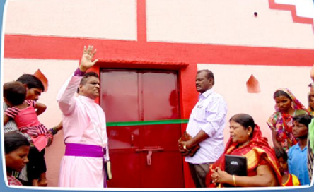
டும்பத் கிராம ஆலய பிரதிஷ்டை மற்றும் சபையாரின் உற்சாகமான வரவேற்பு (இராஜஸ்தான்)