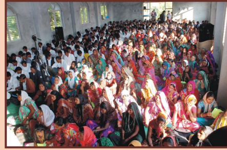
கூடியிருந்த ஊழியர்கள் மற்றும் ஊழியர் மனைவியர்