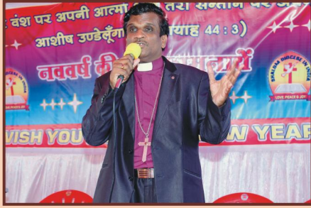
தேவ செய்தி - பிஷப் வி. தேவதாஸ் அவர்கள்