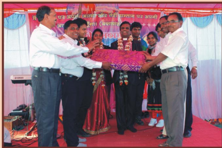
பிஷப் தேவதாஸ் அவர்கள் குடும்பத்திற்கு அன்பளிப்பு கொடுத்து வரவேற்கும் ஊழியர்கள்