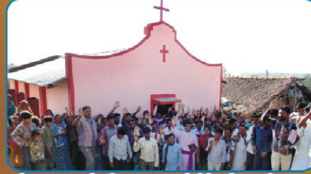
கரம்பா, குஜராத் கிராம ஆலயத்தில் விசுவாசிகளுடன்