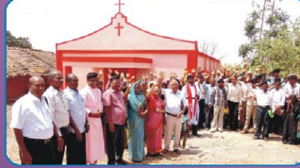
மேந்திகோடா கிராம ஆலயத்தில் விசுவாசிகளுடன்