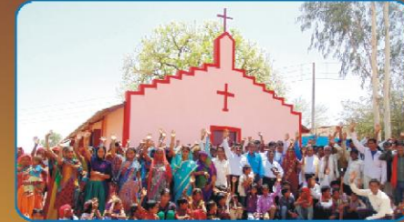
மான்லி (ம.பி.) கிராம ஆலய விசுவாசிகளுடன்