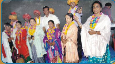
கரம்பா கிராம ஆலயத்தில் கலாச்சார வரவேற்பு