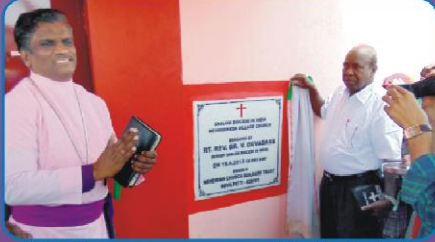
மேந்திகோடா கிராம ஆலய கல்வெட்டுத் திறப்பு