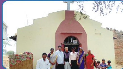
வரங்கோடா (குஜராத்த்) கிராம ஆலயத்தின் முன்பு