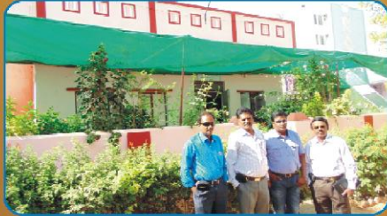
நமது பணித்தள அலுவலகத்திற்கு முன்பு