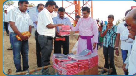
பணித்தளத்தில் விசுவாசிகளுக்கு வழங்கப்பட்ட 100 வேதாகமங்கள்