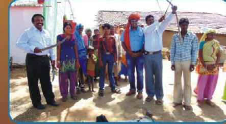
வில் அம்புகளுடன் நமது சகோதரர்கள்