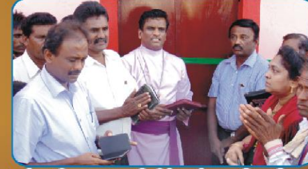
கரம்பா கிராம ஆலய பிரதிஷ்டைக்கான ஜெப வேளை