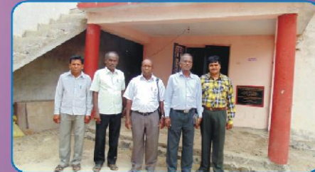
கொலானா (குஜராத்த்) கிராம ஆலயத்தின் முன்பு