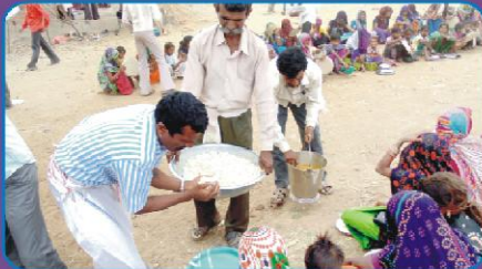
ஆலய பிரதிஷ்டையில் சிறப்பு விருந்து யரிமாறல்