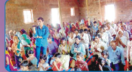
ஆலயத்தில் கூடியிருந்த விசுவாசிகள்