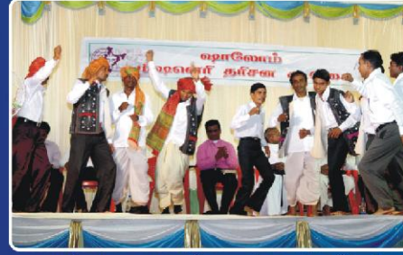
கலாச்சார நடமாடி தேவனைப் பாடித் துதிக்கும் நமது பீல் ஆதிவாசி சுதேச ஊழியர்கள்