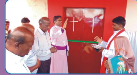
ஆலய பிரதிஷ்டைக்கான ஜெயம்