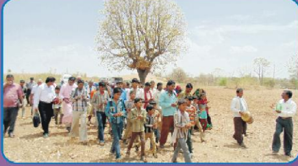
மேளாளங்களுடன் உற்சாக வரவேற்பு