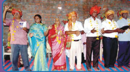
ஆலயத்தில் கலாச்சார வரவேற்பு