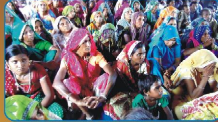
கரம்பா கிராம ஆலயத்தில் கூடியிருந்து விசுவாசிகள்