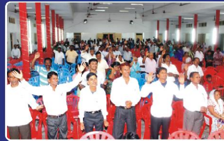
சுடியிருந்த தேவனுள்ளங்களில் ஒரு புகதி