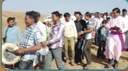
மேளதாளங்களுடன் உற்சாக வரவேற்பு