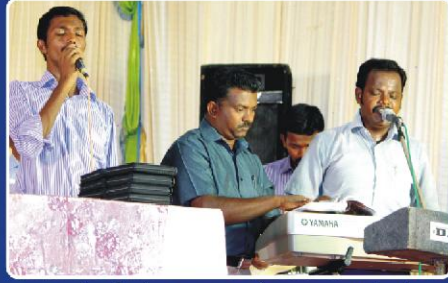
பாடல் மற்றும் ஆராதனை வேளையை நடத்தும் ஹெவன்லி ஜாய் குழுவினர்