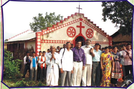
காளகேத், சபை முன்பு விகவாகள் மற்றும் பிஷ்ப் தேவதாஸ் அவர்களுடன் (ம.பி.)