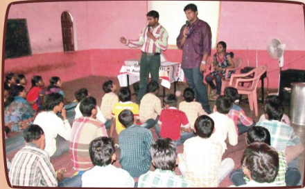
பயிற்சியளிக்கும் சகோ. டைட்டல் அவர்கள்