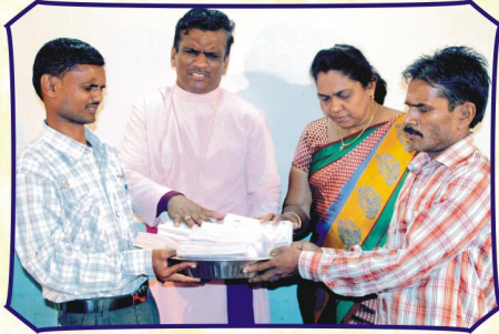
பிட்டோல் கிராம சபையில் (ம.பி.) அன்பு பகிர்வு இயக்கம் செய்தி மலர்