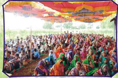
டெப்ரி, கிராம கூடுகையில் கலந்து கொண்ட தேவ ஜனங்கள் (இராஜ்.)