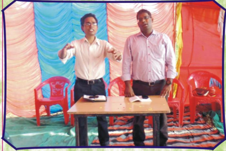
டெப்ரி, கிராம கூடுகையில் செய்தியளிப்பு (இராஜ்.)