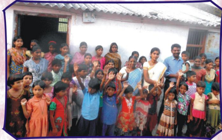
நமது பிஜல்பூர் விடுதி மாணவர்களுடன்