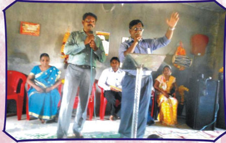
கேடி, ம.பி. கிராம சபையில் செய்தியளிப்பு