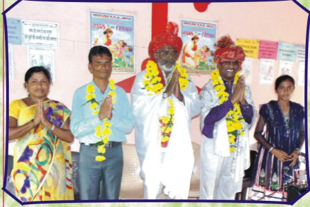
காளகேத், கிராம சபையில் கலாச்சார வரவேற்பு (ம.பி.)