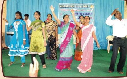
பாடல் மற்றும் ஆராதனை வேளை