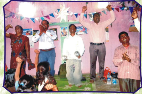
ஜாம்புகேடா, சபையில் ஜெப வேளையில் (ம.பி.)