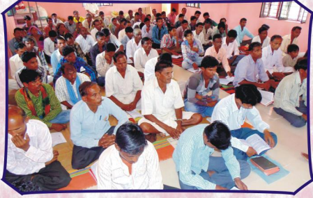
பயிற்சி பெற வந்திருந்த நமது புது ஊழியர்கள் மற்றும் மூப்பர்கள்