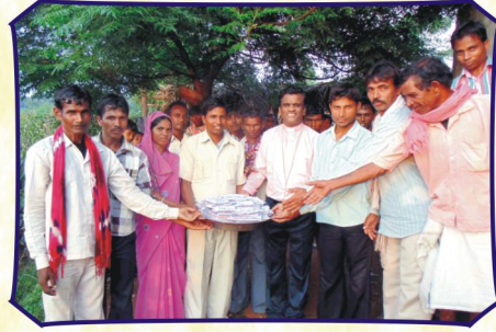
ஒஸ்கா கிராம சபையில் (ம.பி.)