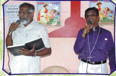
காளகேத், கிராம சபையில் செய்திவேளை (ம.பி.)