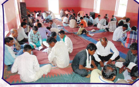
குழு கலந்தாய்வு வேளை