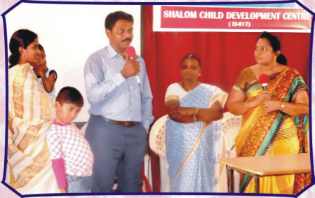
பெண்கள் கூடுகையில் வாழ்த்துரை