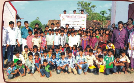
கலந்து கொண்ட மாணவ மாணவியர்