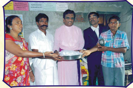
சிமளியா கிராம சபையில் (குஜராத்)