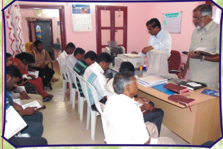
ஷாலோம் பணித்தள அலுவலக காலை தியானத்தில்