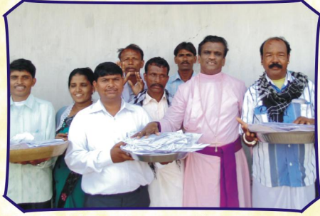
கங்கேலா கிராம சபையில் (குஜராத்)