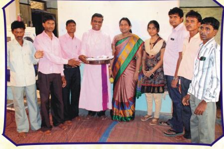
அமளிப்பட்டார் கிராம சபையில் (ம.பி.)