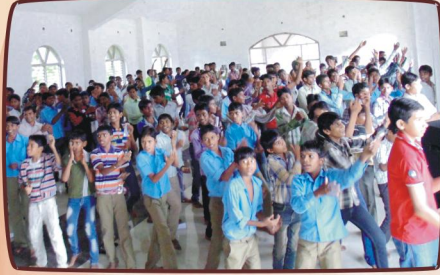
திரளாய் கலந்து கொண்ட வாலிபர்கள்