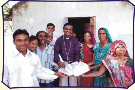
போர்கோடா கிராம சபையில் (குஜராத்)