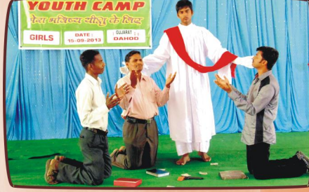
அபிநயப் பாடல் (Choreography)