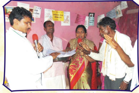
தேதலா கிராம சபையில் (ம.பி.)