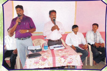
அந்தர்வேலியா, கிராம சபையில், செய்திவேளையில் (ம.பி.)