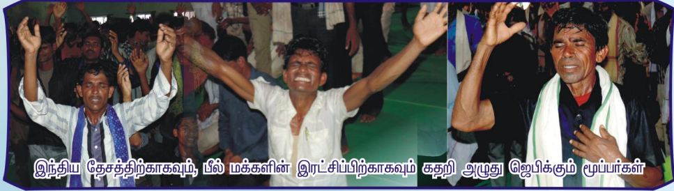
இந்திய தேசத்திற்காகவும், பீல் மக்களின் இரட்சிப்பிற்காகவும் கதறி அழுது ஜெபிக்கும் மூப்பர்கள்