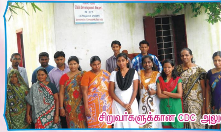
சிறுவர்களுக்கான CDC அலுவலகங்களைப் பார்வையிட்டபோது