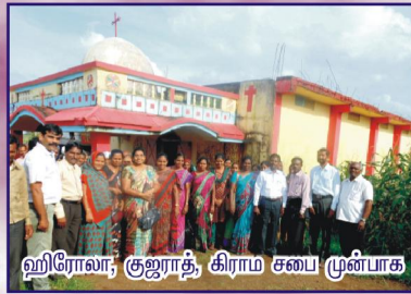
ஹிரோலா, குஜராத், கிராம சபை முன்பாக