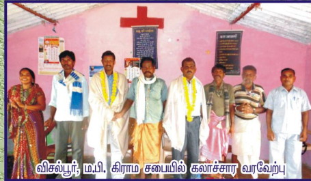
விசல்பூர், மபி, கிராம சபையில் கலாச்சார வரவேற்பு