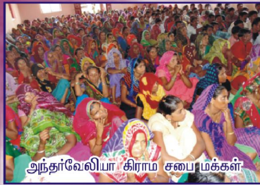
அந்தர்வேலியா கிராம சபை மக்கள்