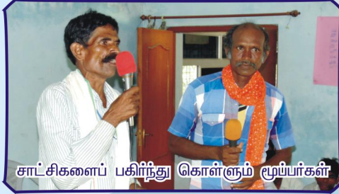
சாட்சிகளைப் பகிர்ந்து கொள்ளும் மூப்பர்கள்