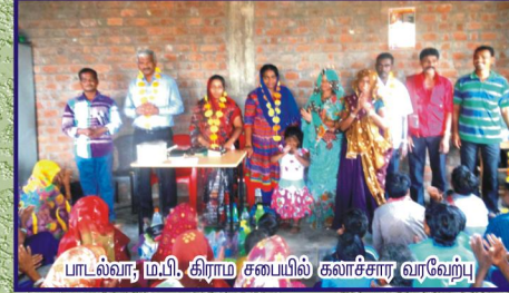
பாடல்வா, மபி, கிராம சபையில் கலாச்சார வரவேற்பு