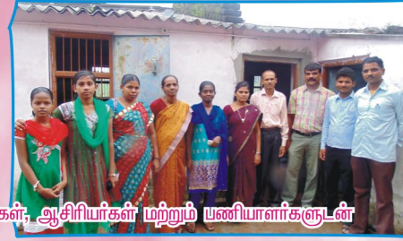
சிறுவர்களுக்கான CDC அலுவலகங்களைப் பார்வையிட்டபோது