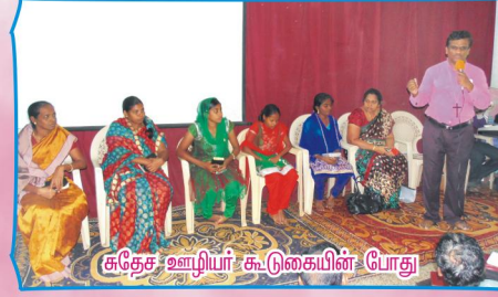
சுதேச ஊழியர் கூடுகையின் போது