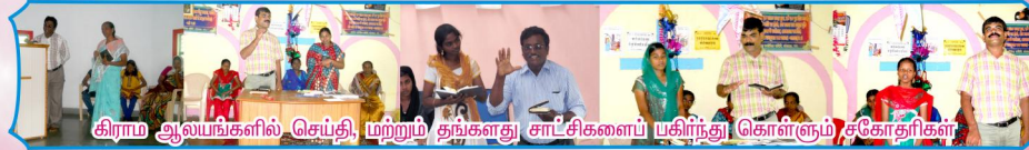
கிராம ஆலயங்களில் செய்தி, மற்றும் தங்களுக்கு சாட்சிகளைப் பகிர்ந்து கொள்ளும் சகோதரிகள்