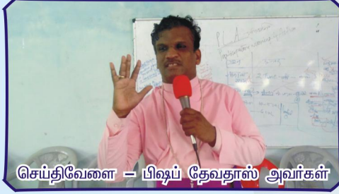
செய்திவேளை – பிஷப் தேவதாஸ் அவர்கள்