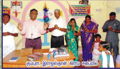
கும்பரா, இராஜஸ்தான் கிராம சபையில்