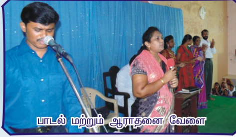
பாடல் மற்றும் ஆராதனை வேளை