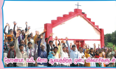
தோண்டா, ம.பி., கிராம ஆலயத்திற்கு முன்பு விசுவாசிகளுடன்