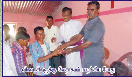
விசுவாசிகளுக்கு வேதாகமம் வழங்கிய போது