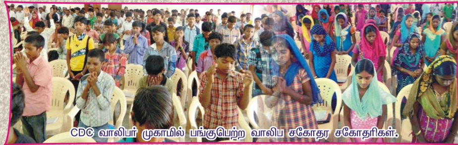
CDC வாலிபர் முகாமில் பங்குபெற்ற வாலிப சகோதர சகோதரிகள்.