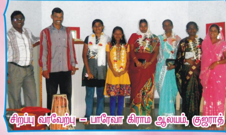
சிறப்பு வர்வேற்பு - யானேவா கிராம ஆலயம், குஜராத்