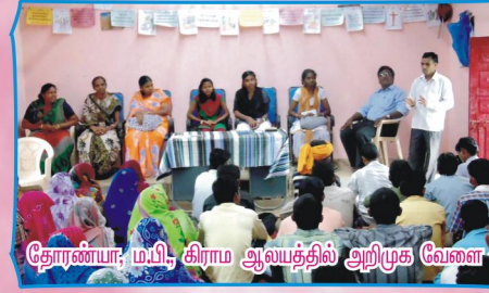
தோண்டா, ம.பி., கிராம ஆலயத்தில் அறிமுக வேளை