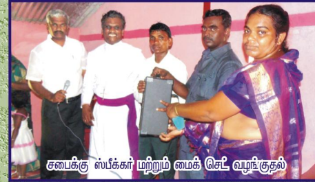
சபைக்கு ஸ்பீக்கர் மற்றும் மைக் செட் வழங்குதல்