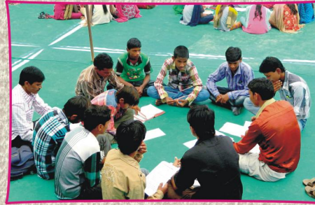
குழு பயிற்சி வேளை