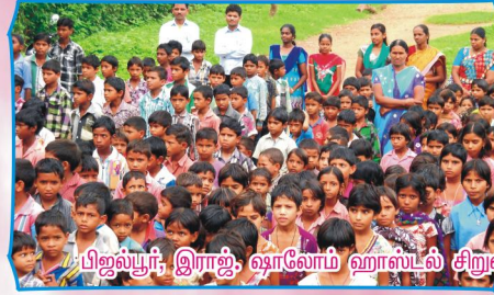
பிஜல்பூர், இராஜ், ஷாலோம் ஹாஸ்டல் சிறுவர்கள், ஆசிரியர்கள் மற்றும் பணியாளர்களுடன்