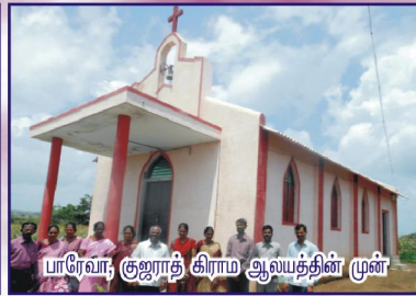
பாரேவா, குஜராத் கிராம ஆயத்தின் முன்