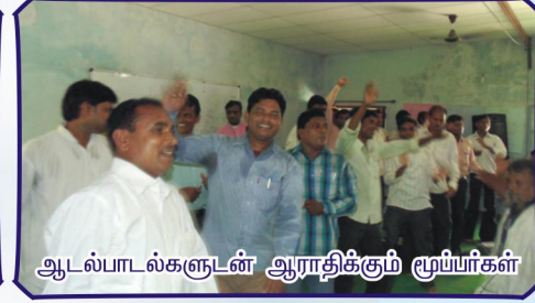
ஆடல்பாடல்களுடன் ஆராதிக்கும் மூப்பர்கள்