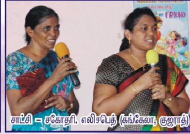
சாட்சி - சகோதரி. எலிசபெத் (கங்கேலா, குஜராத்)