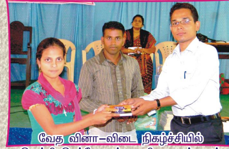
வேத வினா-விடை நிகழ்ச்சியில் வெற்றி பெற்றோருக்கு பரிசு வழங்குதல்