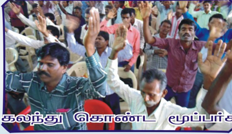
கலந்து கொண்ட மூப்பர்களின் கூட்டம்