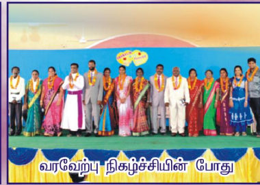
வரவேற்பு நிகழ்ச்சியின் போது