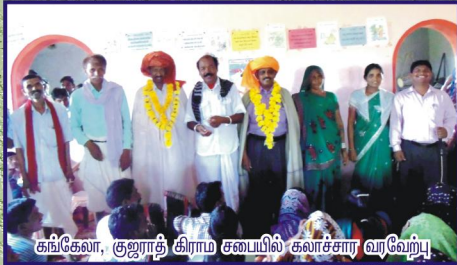
கங்கேவா, குஜராத் கிராம சபையில் கலாச்சார வரவேற்பு