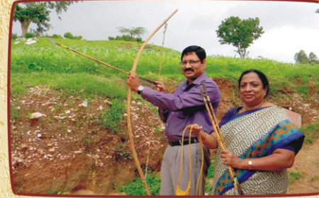
வில் அம்பு மற்றும் கவண்களுடன்