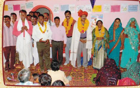
கங்கேலா, குஜராத் கிராம சபையில் கலாசச்சார வரவேற்பு