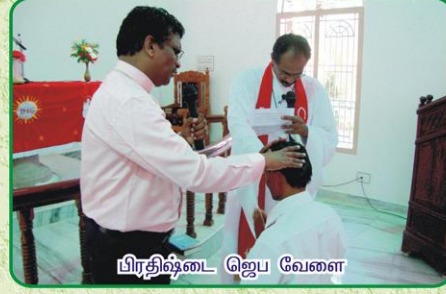
பிரதிஷ்டை ஜெப வேளை