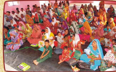
தெல்சர், குஜராத் கிராம சபையில் கூடியிருந்த விசுவாசிகள்