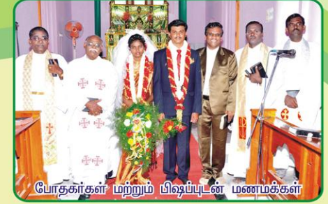
போதகர்கள் மற்றும் பிஷ்ப்புடன் மணமக்கள்