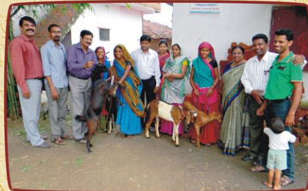
அந்தர்வேலியா, ம.பி கிராமத்தில் ஆடுகள் வழங்குதல் அன்பு பகிர்வு இயக்கம் செய்தி மலர்