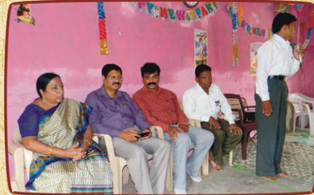
தெல்சர், குஜராத் கிராம சபையில் அறிமுக வேளை