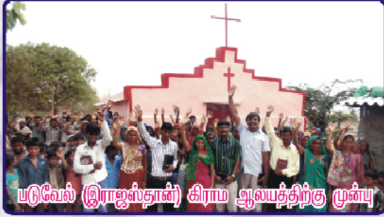
படுவேல் (இராஜஸ்தான்) கிராம ஆலயத்திற்கு முன்பு