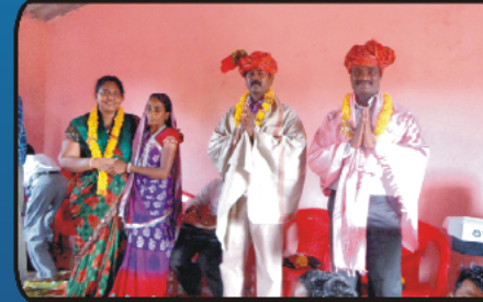
கலாச்சார வரவேற்பின் போது