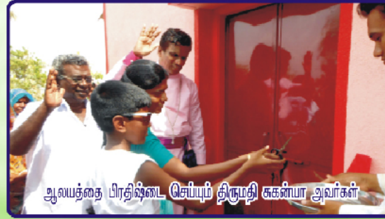
ஆலயத்தை பிரதிஷ்டை செய்யும் திருமதி ககன்யா அவர்கள்