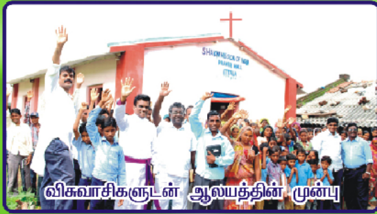
விகவாசிகளுடன் ஆலயத்தின் முன்பு