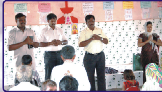
நவாபாடா (ம.பி.) கிராம சபை ஆராதனையில்