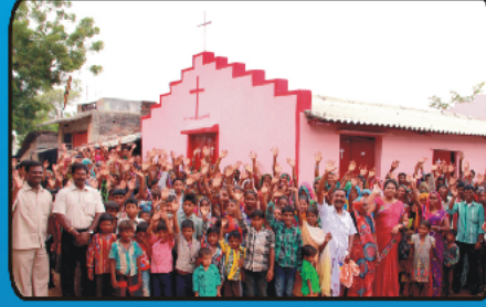
ஆலயத்திற்கு முன்பு விகவாசிகளுடன்