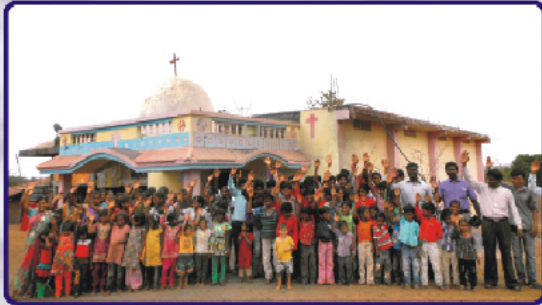
ஹிரோலா (குஜராத்) கிராம ஆலயத்தில் விசுவாசிகளுடன்