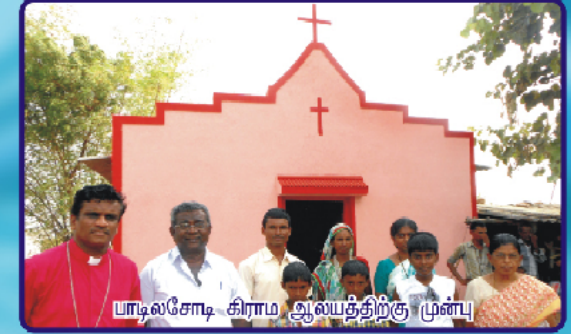
பாடலசோடி கிராம ஆயத்திற்கு முன்பு