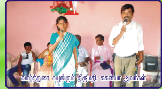
வாழ்த்துரை வழங்கும் திருமதி. ககன்யா அவர்கள்