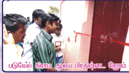
படுவேல் கிராம ஆலய பிரதிஷ்டை ஜெபம்