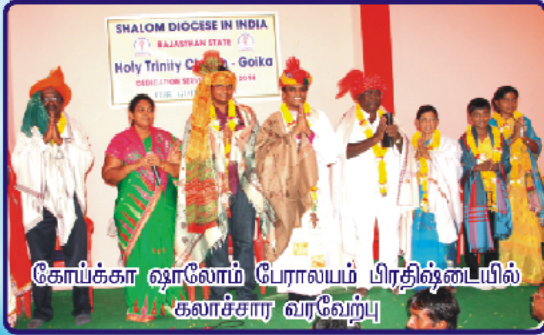
கோய்க்கா ஷாலோம் பேராலயம் பிரதிஷ்டையில் கலாச்சார வரவேற்பு