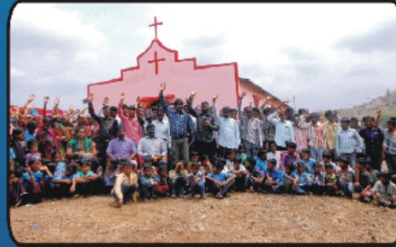
ஆலயத்திற்கு முன்பு விகவாசிகளுடன்