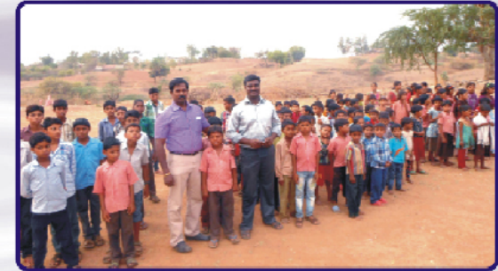
பிஜல்பூர் (இராஜஸ்தான்) விடுதி மாணவர்களுடன்