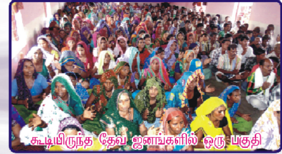
கூட்பிருந்த தேவ ஜனங்களில் ஒரு பகுதி