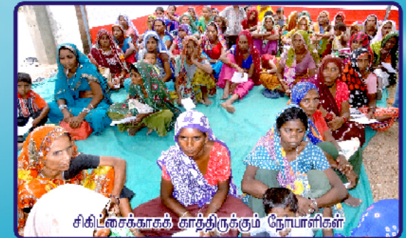
சிகிடசைக்காகக் காத்திருக்கும் நோயாளிகள்