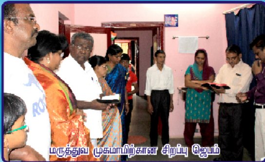
மருத்தவ முகமாவிற்கான சிறப்பு ஜெபம்