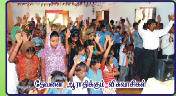
தேவனை ஆராதிக்கும் விகவாசிகள்