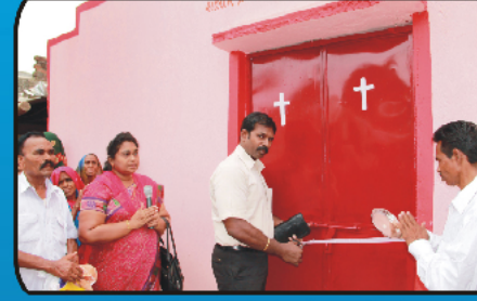
ஆலயத்தைப் பிரதிஷ்டை செய்யும் சகோ. ஜஸ்டஸ் அவர்கள்