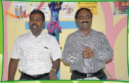
கும்புரா கிராம ஆலயத்தில் செய்தியின் போது