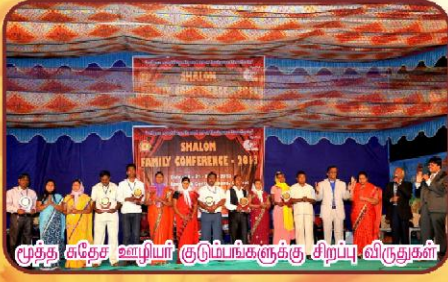
மூத்த சுதேச ஊழியர் குடும்பங்களுக்கு சிறப்பு விருதுகள்