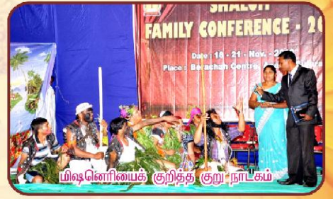
மிஷனரிஸைக் குறித்த குறுநாடகம்