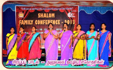
சிறப்புப் பாடல் - அலுவலக ஊழிய சகோதரிகள்