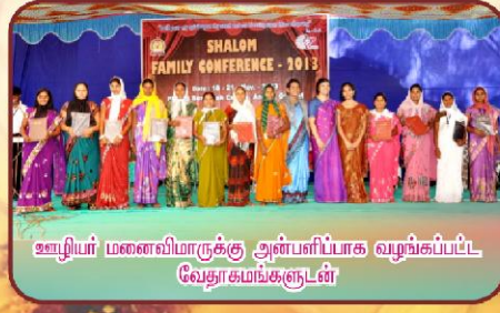
ஊழியர் மனைவிமாருக்கு அன்பளிப்பாக வழங்கப்பட்ட வேதாகமங்களுடன்