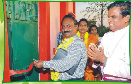
சர்வான் - கிராம ஆலயப் பிரதிஷ்டை