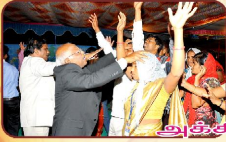
அக்கினி அபிஷேக வேளை