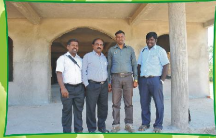
கோய்க்கா கிராமத்தில் கட்டப்பட்டு வரும் நமது ஷாலோம் பேராலயத்தின் முன்பு