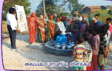
கைப்பம்பு பராமரிப்பு விளக்கம்

ஷாலோம் மற்றும் CBN ஸ்தாபனமும் இணைந்து, பீல் ஆதிவாசி ஜனங்கள் வசிக்கும் கிராமங்களிலுள்ள 25 இடங்களில் குடிநீருக்காகப் போடப்பட்ட ஆழ் குழாய் கிணறுகளும் கைப் பம்புகளும்