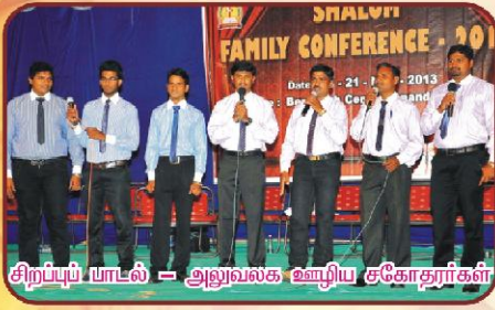
சிறப்புப் பாடல் - அலுவலக ஊழிய சகோதரிகள்