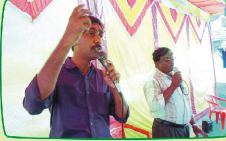
பேடவ், கிராமத்தில் நடைபெற்ற சிறப்புக் கூடுகையில் (இராஜஸ்தான்)