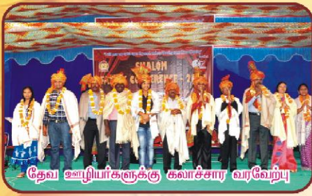
தேவ ஊழியர்களுக்கு கலாச்சார வரவேற்பு