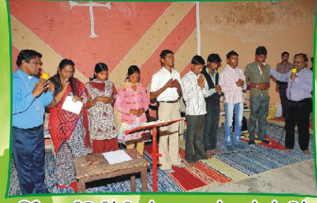
இயேசு விடுவிக்கிறார் மூலமாகத் தாங்கப்படும் பில் ஆதிவாசி மாணவர்களுக்கு சிறப்பு ஜெபம்