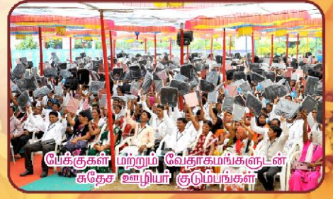
யேக்குகள் மற்றும் வேதாகமங்களுடன் சுதேச ஊழியர் குடும்பங்கள்