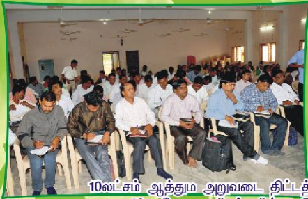
10வ்சம் ஆத்தம அறுவடை திட்டத்திற்காக தேவனால் தெரிந்தெடுக்கப்பட்ட 48 கதேச ஊழியர்களின் குடும்பங்களுக்கான சிறப்புக் கூடுகை