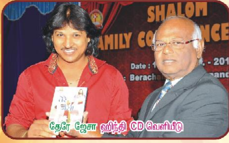
தேரே ஜோசா ஹிந்தி CD வெளியீடு