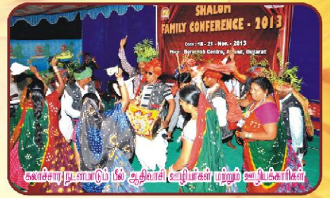
கலாச்சார நடனமும் பீல் ஆதிவாசி ஊழியர்கள் மற்றும் அபிப்பக்கிகள்