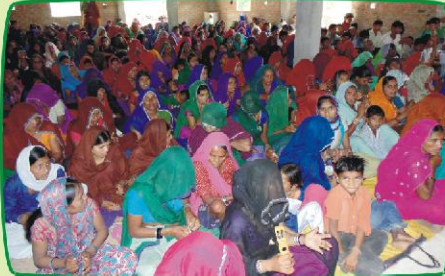
வால்பூர் கிராம சபையில் கூடியிருந்த தேவ ஜனங்கள் (ம.பி.) அன்பு பகிர்வு இயக்கம் செய்தி மலர்