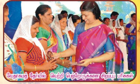
வேதாகமத் தேர்வில் வெற்றி பெற்றோர்களை சிறப்புப் பரிசுகள்