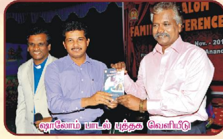
ஷாலோம் யாடல் யுத்தக வெளியீடு