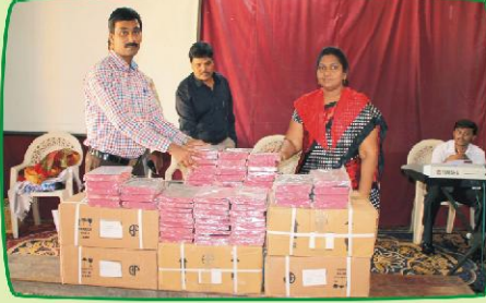
மீல் ஆதிவாசி விசுவாசிகளுக்கு வழங்கப்பட்ட வேதாகமங்களுடன்