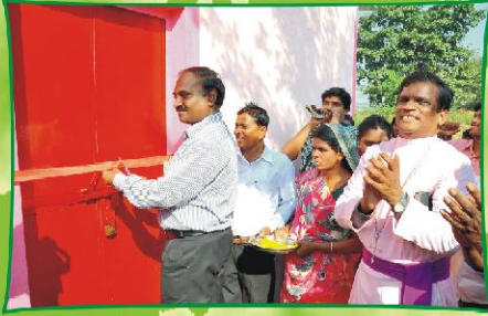
பாட்வா கட்டடா - கிராம ஆலயப் பிரதிஷ்டை