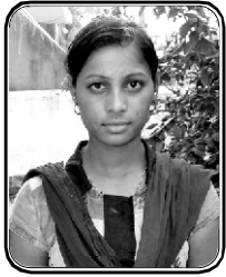
பெயர் ஹன்சா மங்கு புரியா கிராமம் : பாட்டன்புரா, குஜராத்