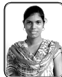
பெயர் சாந்தி கல்லா கிராமம் : போர்பாடோட், இராஜ்