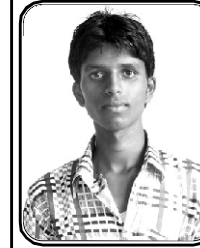
பெயர் நிலேஷ் நான்கு கிராமம் : ஹரேந்திரகட், இராஜ்