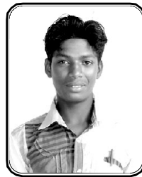
பெயர் அணில் ஈஸ்வர்லால் டிண்டோர் கிராமம் : பர்னாலா, இராஜ்