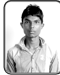
பெயர் ஈஸ்வர்லால் ஹர்தா ஹடா கிராமம் : ஹரேந்திரகட், இராஜ்