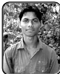
பெயர் திவிப் அமர்சிங் வாகனியா கிராமம் : ஹத்தியாதள்ளி, ம.பி.