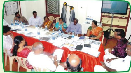
குழு கலந்தாய்வு வேளை