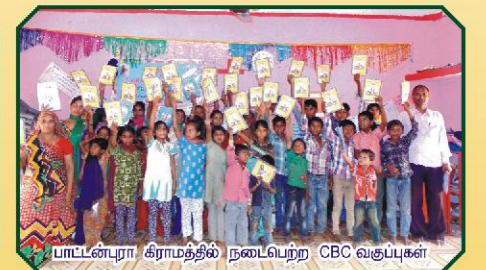
பாட்டன்பூரா கிராமத்தில் நடைபெற்ற CBC வகுப்புகள்