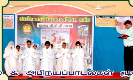
& அபிநயப்பாடல்கள் மூலம் பயிற்சி