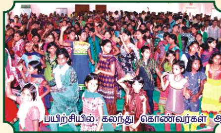
பயிற்சியில் கலந்து கொண்டவர்கள் ஆடிப்பாடி தேவனை ஆராதிக்கும் வேளை