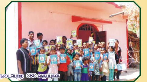
பாட்டன்பூரா கிராமத்தில் நடைபெற்ற CBC வகுப்புகள்