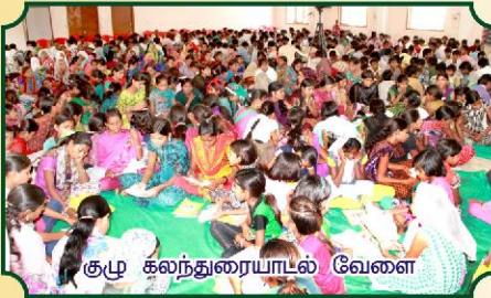
குழு கலந்துரையாடல் வேளை