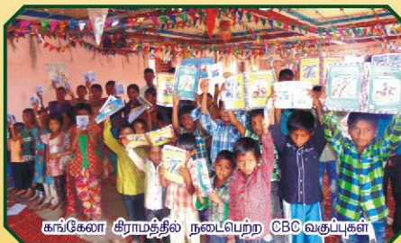
கங்கோ கிராமத்தில் நடைபெற்ற CBC வகுப்புகள்