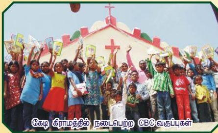
கேடி கிராமத்தில் நடைபெற்ற CBC வகுப்புகள்