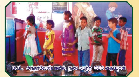
ம.பி. அந்தர்வேலியாவில் நடைபெற்ற CBC வகுப்புகள்