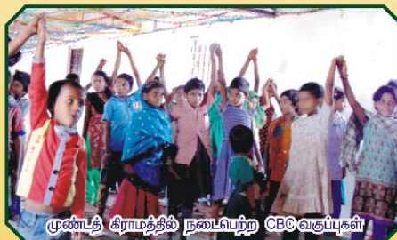
முண்டி கிராமத்தில் நடைபெற்ற CBC வகுப்புகள்