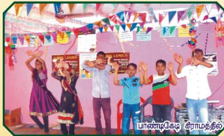
பாண்டிகேடி கிராமத்தில் நடைபெற்ற CBC வகுப்புகள்