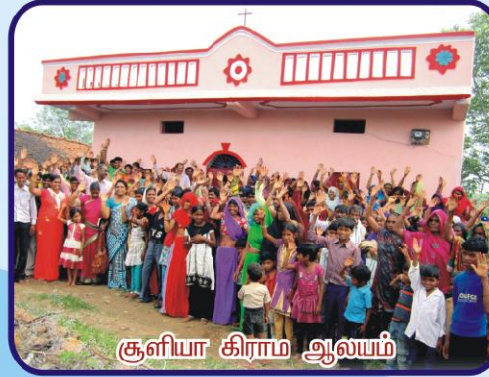
சூளியா கிராம ஆலயம்