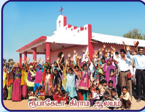
ரூபாகேடா கிராம ஆலயம்