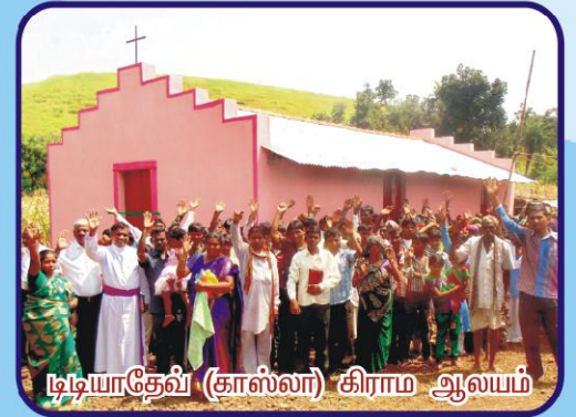
டிடியாதேவ் (காஸ்லா) கிராம ஆலயம்