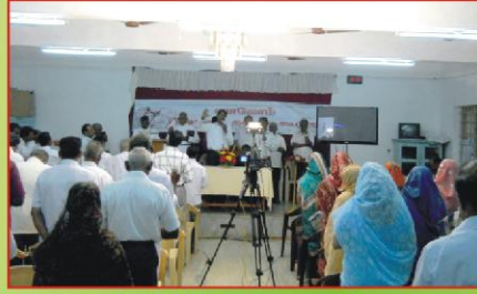
பாடல் மற்றும் ஆராதனை வேளை