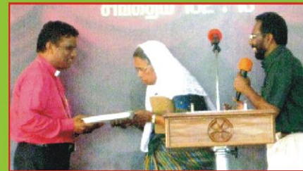
சபையின் சார்பில் ஆலயம் கட்ட காணிக்கையாக ரூ. 1 லட்சம் வழங்கப்பட்டது.