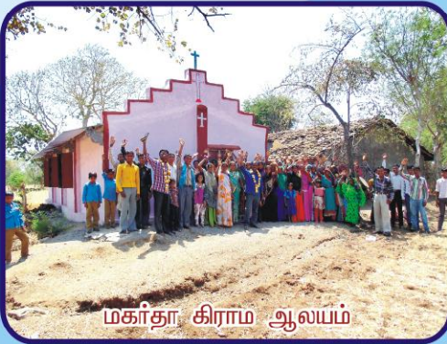
மகர்தா கிராம ஆலயம்