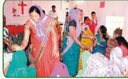
கலந்து கொண்ட ஒவ்வொருவருக்கும் சிறப்பு ஜெபம்