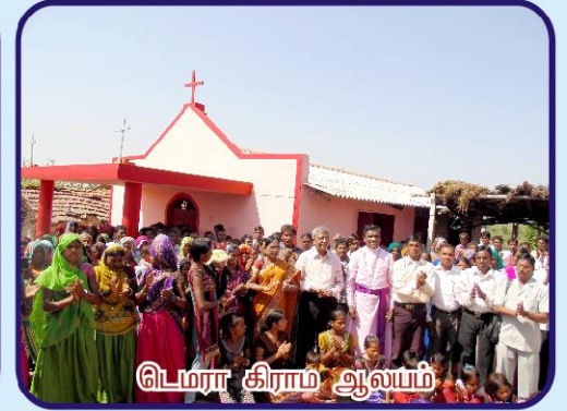
டெமரா கிராம ஆலயம்