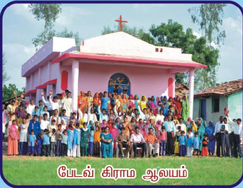
பேடவ் கிராம ஆலயம்