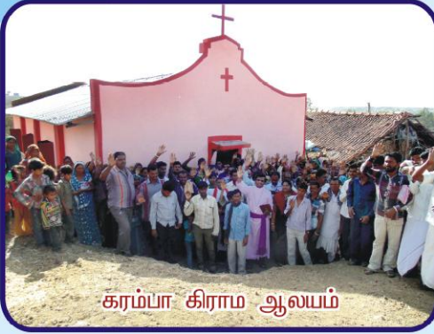
கரம்பா கிராம ஆலயம்