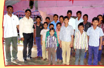
இராஜஸ்தான், கோய்க்கா ஹாஸ்டல் சிறுவர்களுடன்