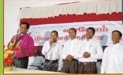
பீல் சுதேச ஊழியர்களின் சாட்சி வேளை