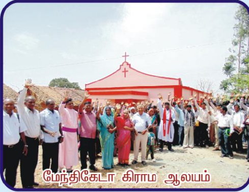
மேந்திகேடா கிராம ஆலயம்