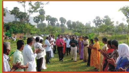
பிஷம், தேவதாஸ் அவர்களுக்கு வரவேற்பு