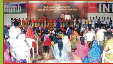
ஆராதனையில் கலந்து கொண்ட தேவ ஜனங்கள்