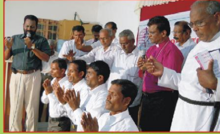
பீல் சுதேச ஊழியர்களின் பிரதிஷ்டை வேளை