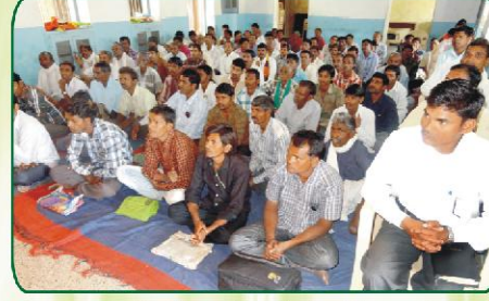
குஜராத், ஜெரி பகுதி மூப்பர்களின் கூடுகை