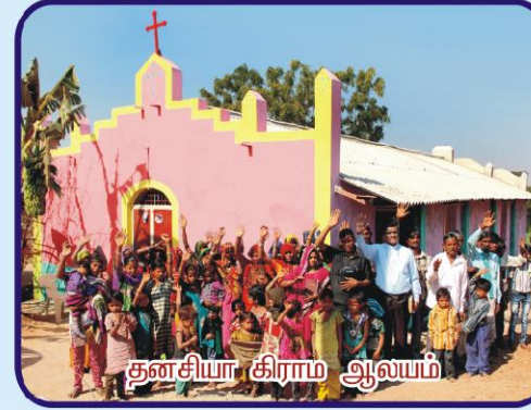
தனசியா கிராம ஆலயம்