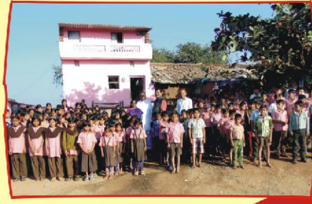
பிஜல்பூர் ஹாஸ்டல் மாணவர்களுடன்