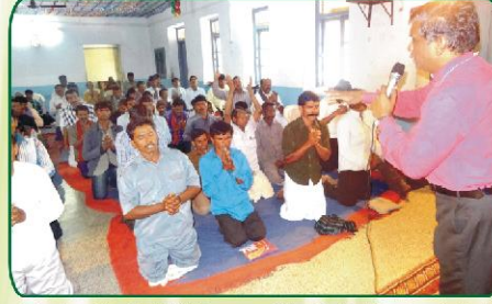
பீல் மக்களின் இரட்சிப்பிற்காக பாரத்தோடு ஜெபிக்கும் மூப்பர்கள்