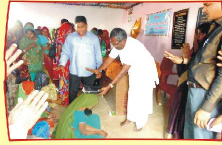
முண்டத் கிராம சபை விசுவாசிகளுக்கு சிறப்பு ஜெபம் அளிப்பு பகிர்வு இயக்கம் செய்தி மலர்