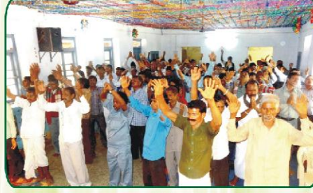
தேவனை ஆராதிக்கும் மூப்பர்கள்