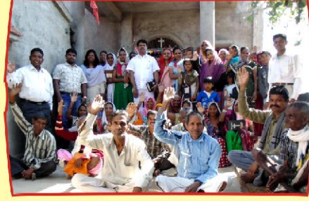
குஜராத்த், தெல்சர் கிராம சபை விசுவாசிகளுடன்