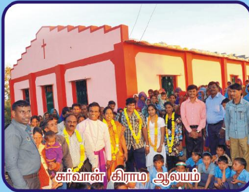
சர்வான் கிராம ஆலயம்