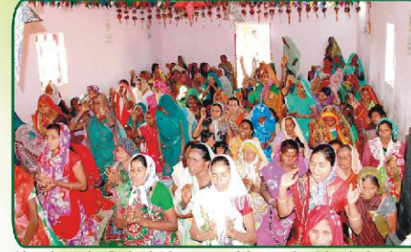
பீல் மக்களின் இரட்சிப்பிற்காக பாரத்தோடு ஜெபிக்கும் பெண்கள்