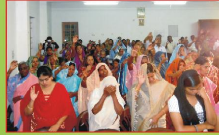
கூடியிருந்த தேவ ஜனங்களில் ஒரு பகுதி