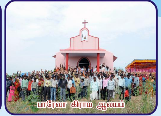
பாரேவா கிராம ஆலயம்