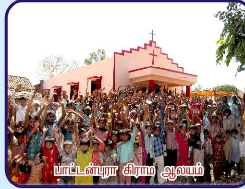
யாட்டன்புரா கிராம ஆலயம்