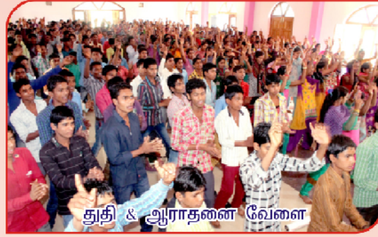
துதி & ஆராதனை வேளை