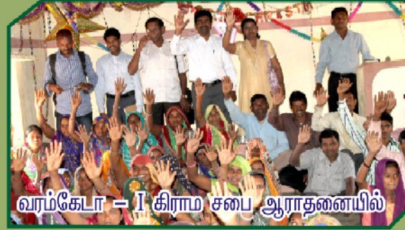
வரங்கேடா - I கிராம சபை ஆராதனையில்