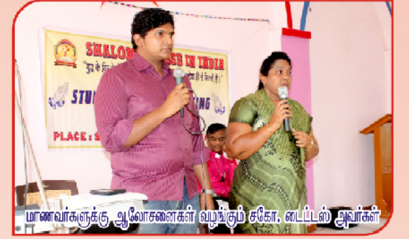
மாணவர்களுக்கு ஆலோசனைகள் வழங்கும் சகோ, டைட்டல் அவர்கள்