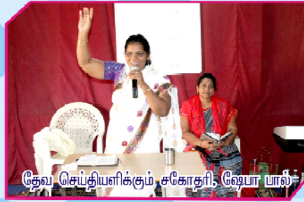
தேவ செய்தியளிக்கும் சகோதரி வேபா பால்