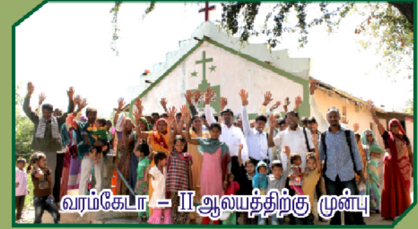
வரங்கேடா - II ஆலயத்திற்கு முன்பு