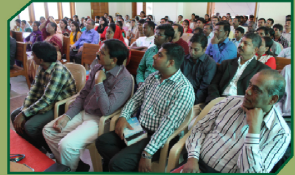
கிரின் சிட்டி ஆலய ஞாயிறு ஆராதனை, காந்தி நகர், குஜராத் - 08.02.2015