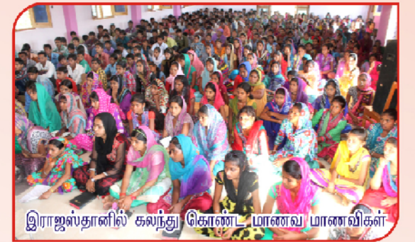
இராஜஸ்தானில் கலந்து கொண்ட மாணவ மாணவிகள்