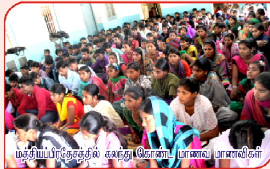
மத்தியப்பிரதேசத்தில் கலந்து கொண்ட மாணவ மாணவிகள்