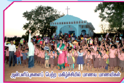
அன்பளிப்புகளைப் பெற்ற மகிழ்ச்சியில் மாணவ மாணவிகள்