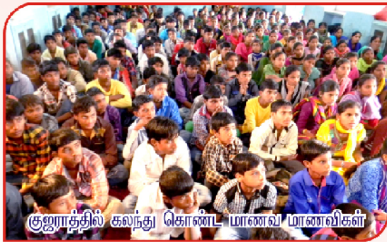
குஜராத்தில் கலந்து கொண்ட மாணவ மாணவிகள்