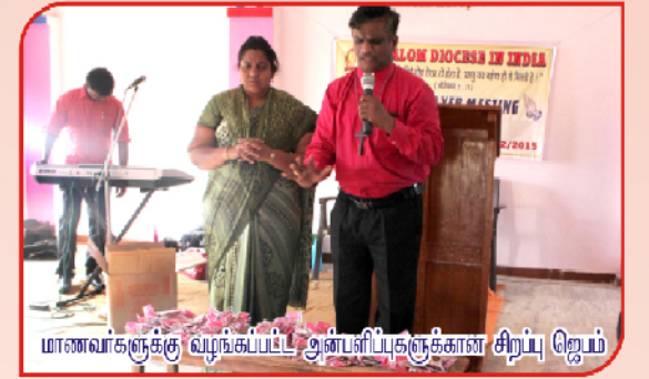
மாணவர்களுக்கு வழங்கப்பட்ட அன்பளிப்புகளுக்கான சிறப்பு ஜெயம்