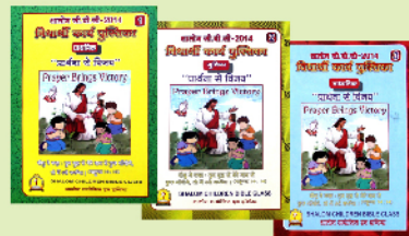
கடந்த ஆண்டின் CBC பயிற்சிப் புத்தகங்கள்

தேவன்தாமே உங்களையும் உங்கள் குடும்பத்தின் பிள்ளைகளையும் ஆசீர்வதிப்பாராக!