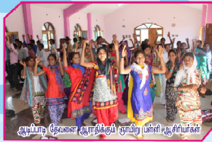
ஆடிப்பாடி தேவனை ஆரதிக்கும் ஞாயிறு பள்ளி ஆசிரியர்கள்