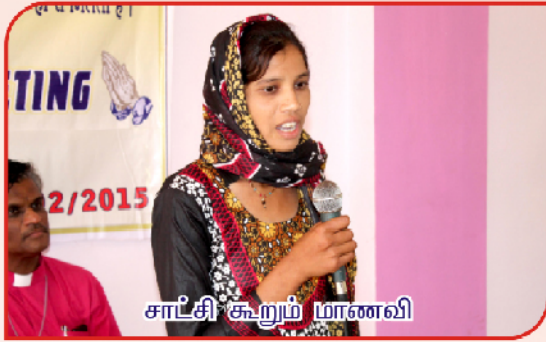
சாட்சி கூறும் மாணவி