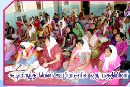
கூடியிருந்த பெண் ஊழியர்களில் ஒரு பகுதியினர்