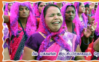
பீல் மக்களின் இரட்சிப்பிற்காகவும், தேசத்திற்காகவும் கதறி ஜெபிக்கும் ஊழியர்கள்