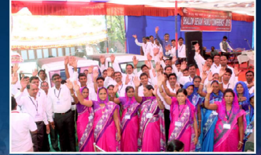
10 லட்சம் ஆத்தம அறுவடைத் திட்டத்திற்காக இயேசு விடுவிக்கிறார் மூலமாக ஜெபித்து வழங்கப்பட்ட இரண்டு டாட்டா மேஜிக் வாகனங்கள்