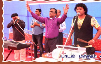
பாடல் மற்றும் ஆராதனை வேளை