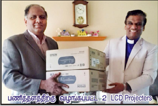
பணித்தளத்திற்கு வழங்கப்பட்ட 2 LCD Projectors