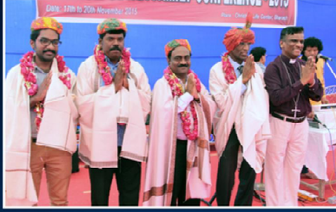
இயேசு விடுவிக்கிறார் குழுவினருக்கு கலாச்சார வரவேற்பு