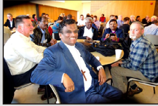
BILD Conference - ல் பங்குபெற்றோர்