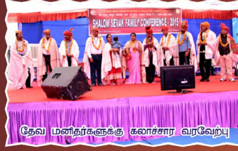
தேவ மனதர்களுக்கு கலாச்சார வரவேற்பு