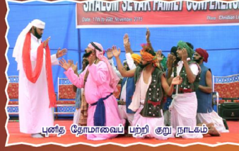
புனித தோமாவைப் பற்றி குறு நாடகம்