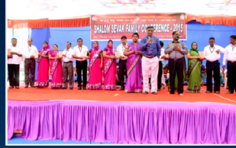
இயேசு விடுவிக்கிறார் மூலமாக பீல் சுதேச ஊழியர்களுக்கு வழங்கப்பட்ட அன்பளிப்புகளுடன்