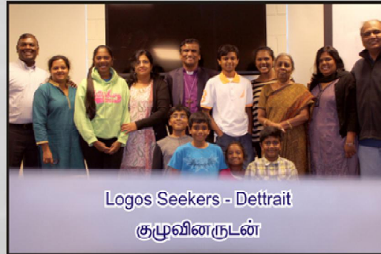
Logos Seekers - Detrait குழுவினருடன்