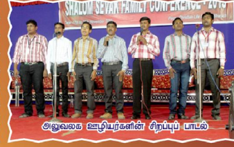
அலுவலக ஊழியர்களின் சிறப்புப் பாடல்