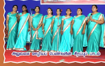
அலுவலக ஊழிய பெண்களின் சிறப்புப் பாடல்