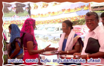
மண்பாட வசனம் கூறிய ஊழியர்களுக்கு பரிசுகள்