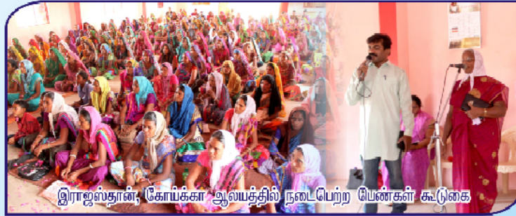
இராஜஸ்தான், கோய்க்கா ஆலயத்தில் நடைபெற்ற பெண்கள் கூடுகை