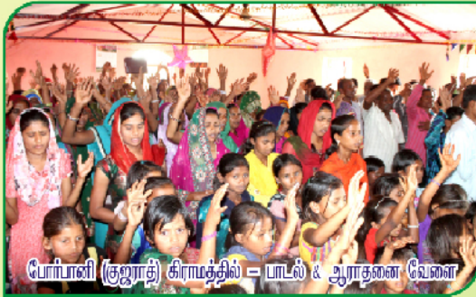
போர்பானி (குஜராத்தி) கிராமத்தில் = பாடல் & ஆராதனை வேளை