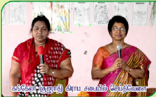
கங்கேலா (குஜராத்தி) கிராம சபையில் செய்திவேளை