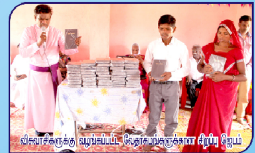
விவாசிகளுக்கு வழங்கப்பட்ட வேதாகமங்களுக்கான சிறப்பு ஜெபம்