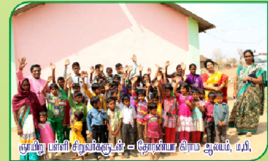
ஞாயிறு பள்ளி சிறுவர்களுடன் = தோரணியா கிராம ஆயம், ம.பி.