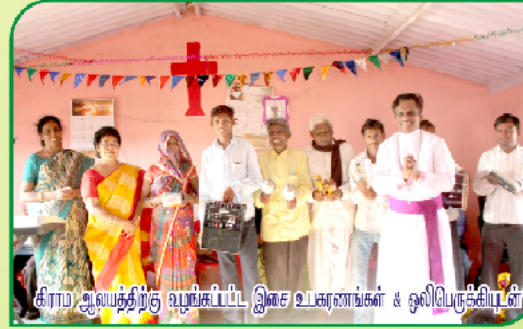
கிராம ஆயத்திற்கு வழங்கப்பட்ட இசை உபகரணங்கள் & ஒலிபெருக்கிகள்