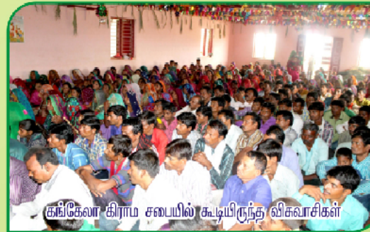
கங்கேலா கிராம சபையில் கூடியிருந்த விசுவாசிகள்