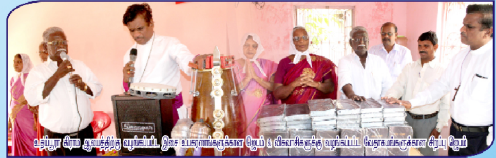
உதய்பூர் சிராம ஆலயத்திற்கு வழங்கப்பட்ட இலட்ச உபகரணங்களுக்கான ஜெபம் & விவாசிகளுக்கு வழங்கப்பட்ட வேதாகமங்களுக்கான சிறப்பு ஜெபம்