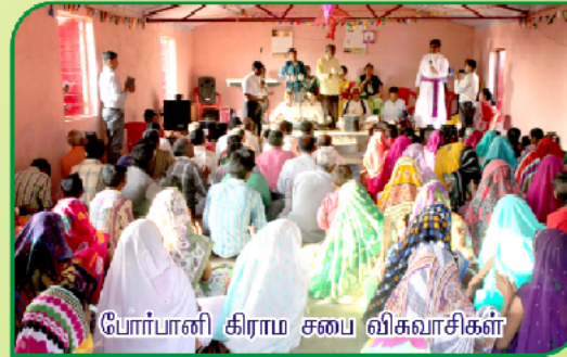
போர்பானி கிராம சபை விசுவாசிகள்