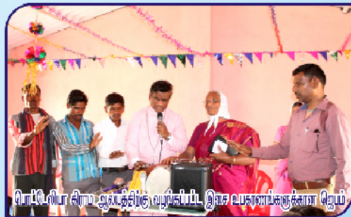
பொட்டிலியா சிராம ஆலயத்திற்கு வழங்கப்பட்ட இலட்ச உபகரணங்களுக்கான ஜெபம்