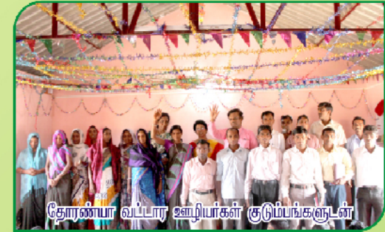
தோரணியா வட்டார ஊழியர்கள் குடும்பங்களுடன்