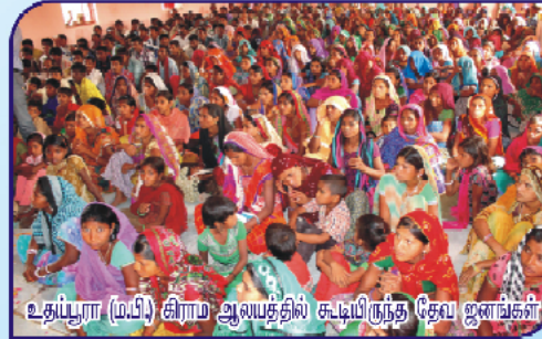
உதய்பூர் (ம.பி) சிராம ஆலயத்தில் கூடியிருந்த தேவ ஜனங்கள்