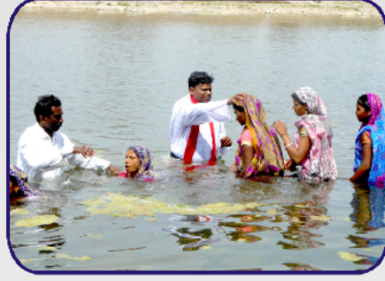
காசலா, ஸுன்கேடா மற்றும் அந்தர்வேலியா கிராம விசுவாசிகளுக்கு திருமுழுக்கு கொடுக்கும் போதகர். காளியா பாபோர், போதகர். அமர்சிங் கத்திஜா & போதகர். புர்சன் புரியா