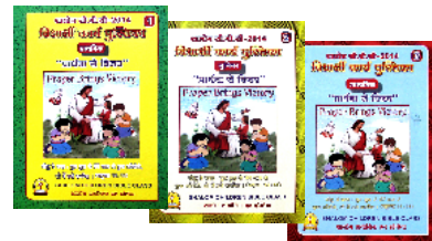
கடந்த ஆண்டின் CBC பயிற்சிப் புத்தகங்கள்

தேவன் தாமே உங்களையும் உங்கள் குடும்பத்தின் பிள்ளைகளையும் ஆசீர்வதிப்பாராக !