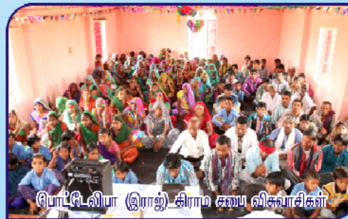
பொட்டிலியா (இராஜ) சிராம கலைய விவாசிகள்