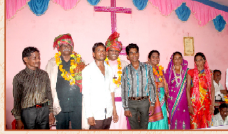
பாட் லா கல்வானி கிராம ஆலயத்தில் கலாச்சார வரவேற்பு