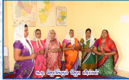
கூடி ஜெபிக்கும் ஜெப வீரிகள்