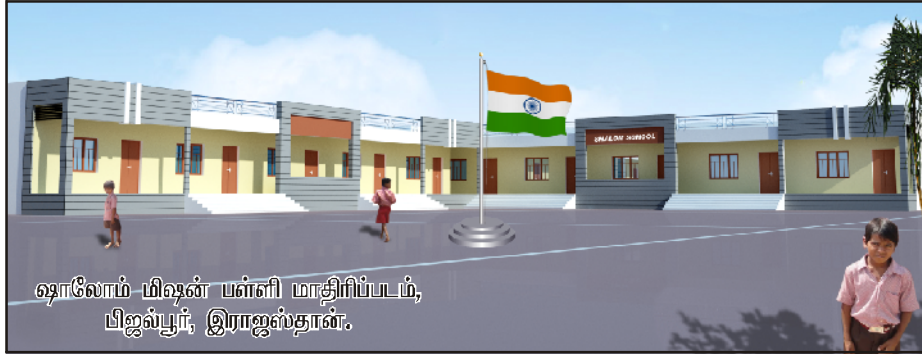
ஷாலோம் மிஷன் பள்ளி மாதிரிப்படம், பிஜல்பூர், இராஜஸ்தான்.

கட்டப்பட்ட சிறிய அறைகளில் தான் பள்ளி வகுப்புகள் உள்ளது. பகலில் வகுப்பறையாகவும் இரவில் தங்கும் அறையாகவும் உபயோகித்து வருகிறார்கள். வெள்ளிவிழா ஆண்டில் பள்ளிக்கூடத்துக்கு 10 அறைகள் மற்றும் 100 பெண் பிள்ளைகளுக்கான விடுதி அறைகள் கட்டப்பட வேண்டும்.