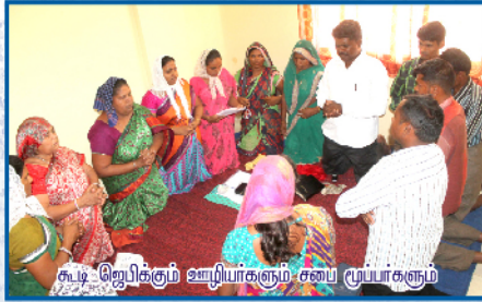
கூடி ஜெபிக்கும் ஊழியர்களும் சபை மூப்பர்களும்