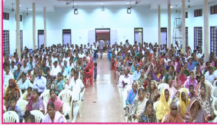
கூடியிருந்த தேவ ஜனங்கள்