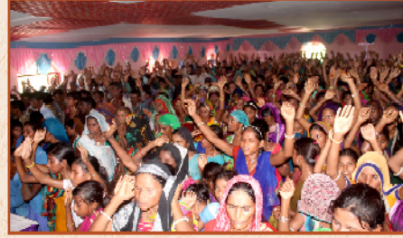
பாட் லா கல்வானி கிராம ஆலயத்தில் கூடியிருந்த தேவ ஜனங்கள்