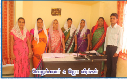
மொழியியலாளர் & ஜெப வீரிகள்