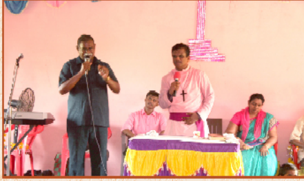
பாட் லா கல்வானி கிராம ஆலயத்தில் தேவ செய்தி