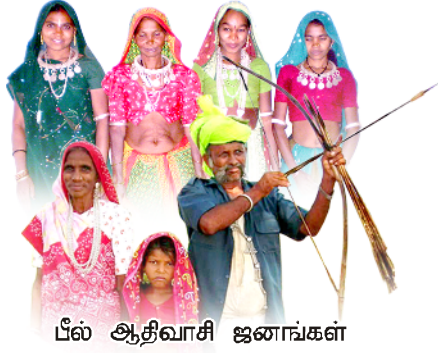
பீல் ஆதிவாசி ஜனங்கள்

பீல் ஆதிவாசி மக்கள் மத்தியில் நடைபெறும் மிஷனரி தரிசன பணி