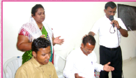
பிரதிஷ்டை செய்யப்படும் சுதேச ஊழியர்