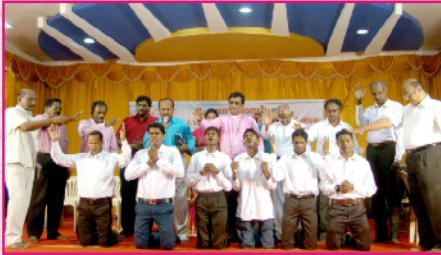
கூடுகையில் பிரதிஷ்டை செய்யப்பட்ட ஊழியர்கள்