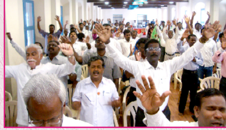
ஷாலோம் ஊழியங்களுக்காக ஜெபிக்கும் போதகர்கள்