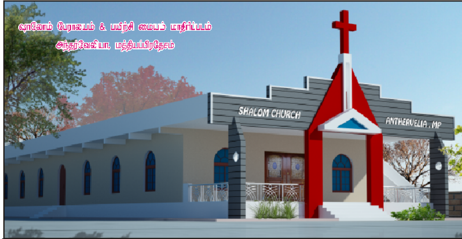
அன்பு பகிர்வு இயக்கம் செய்தி மலர்

இந்நாட்களில் மத்தியப்பிரதேசத்தில் பீல் மக்கள் மத்தியில் எழுப்புவதை கட்டளையிட்டு வருகிறார். ஊழியர்கள் கூடுகை, மூப்பர்கள் கூடுகை, வாலிபர் கூடுகை, சிறுவர்கள் முகாம், எழுப்புவதல் முகாம்கள், ஜெபமுகாம்கள் மற்றும் பகுதிவாரிய திட்டக் கூடுகைகளை நடத்த அந்தர்வேலியா கிராமத்தில் தேவன் நமக்கு சுமார் 2 ஏக்கர் நிலத்தை தந்துள்ளார். அங்கு 120 X 40 அளவில் Hall ஒன்றும் மேலும் தேவையான அறைகள் கட்டப்பட Compound wall கட்டப்பட இரண்டு ஊழியர்கள் தங்கியிருக்க, ஜெப ஊழியங்கள் நடத்தப்பட கட்டிடங்கள் வேண்டும்.