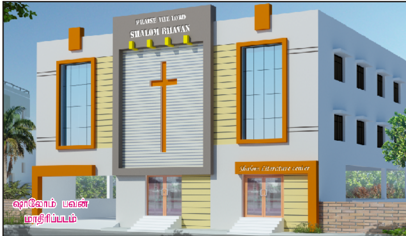
ஷாலோம் பவன் மாடிரியப்படம்

தேவ கிருபையால் உருவாக்கப்பட்ட 25 வருட பணிகளை நிர்மாணிக்கவும் செயல்படுத்தவும் குஜராத் தாகோத்தில் பணித்தள அலுவலகம் உள்ளது. இந்தக் கட்டிடம் சுமார் 3600 சதுர அடி நிலத்தில் 30 வருடங்களுக்கு முன்பு கட்டப்பட்ட பழைய கட்டிடமாகும். இதை உடைத்து விட்டு, கீழ்க்காணும் அனைத்து துறைகளும் (Departments) ஒருங்கிணைந்து செயல்பட ஷாலோம் பவன் கட்டிடத்தைக் கட்டியெழுப்ப வேண்டும்.