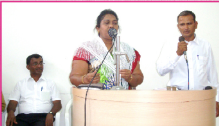
சுதேச ஊழியரின் சாட்சி வேளை அன்பு பகீர்வு இயக்கம் செய்தி மலர்