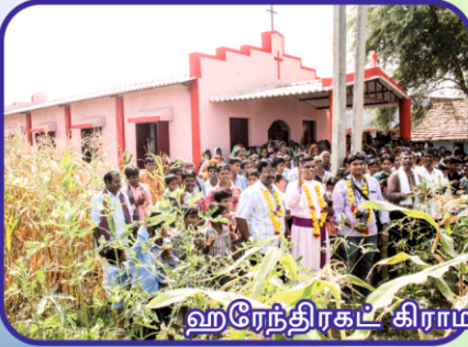
ஹரேந்திரகட் கிராம ஆலய பிரதிஷ்டை...