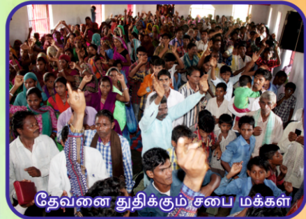
தேவனை துதிக்கும் சபை மக்கள்